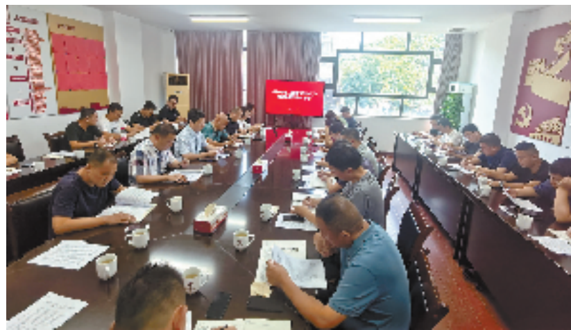
余杭区余杭街道二次供水改造工作推进会暨任务部署会现场

据了解,湖山帝景湾小区(北区)建成于2013年,近两年来,小区高层用户普遍反映存在供水水压不足、用水高峰期水龙头出水小、水质发黄等问题。为彻底解决小区居民用水问题,2021年,余杭街道将该小区列入了二次供水改造计划,并与“污水零直排”改造、小区综合提升等工程同步推进,将施工对小区居民生活的影响降到最低。今年上半年,湖山帝景湾小区(北区)二次供