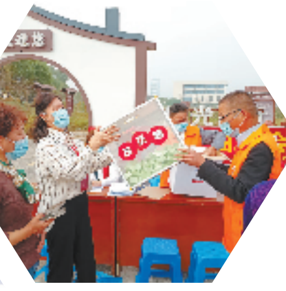
“社区微田园”友邻基金项目启动现场