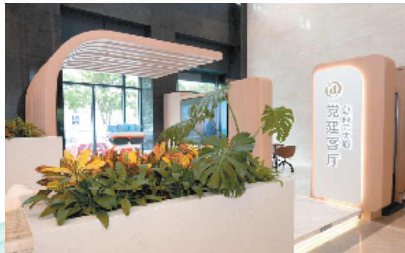
平湖市总商会大厦党建客厅一角