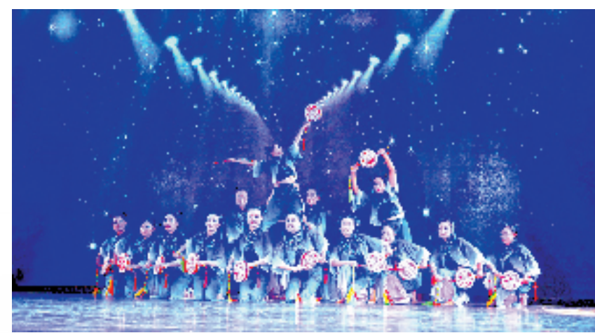
文艺演出精彩纷呈

文艺星火，可以燎原。从旅游景点的唐诗风韵，到文化礼堂的管弦不绝，文韵流淌在天台的大街小巷，千年积淀的文化根脉向上蓬勃生长、抽枝散叶，为群众精神富有“加码”。