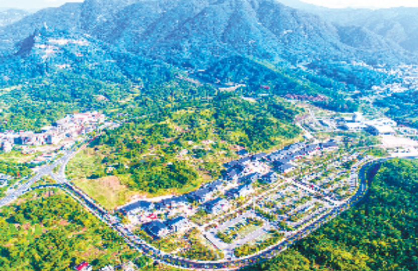
和合小镇

2021年，天台共接待游客402.98万人次，同比增32.6%，旅游总收入41.76亿元，同比增36.1%，过夜游客164.4万人次，同比增长7.5%。