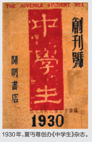
1930年,夏丏尊创办《中学生》杂志。