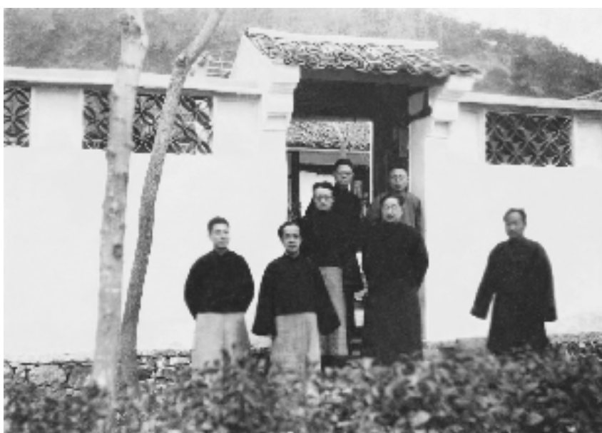
1928年3月,夏丏尊(右一)与叶圣陶、胡愈之、章锡琛、贺昌群、周予同、章克标在白马湖畔。

举”在此扎根,中国语文教学在此革新。夏丏尊在同仁的积极影响和感召下汲取文学知识,启蒙艺术素养,探寻教育救国之路。1921年2月,夏丏尊辞去湖南第一师范学校教职来到上海,和上海共产主义小组成员陈独秀、李大钊等发起成立“新时代丛书社”,希望通过译介新知识、新思想著作,普及新文化运动,为有志做进一步高深研究者提供理论基础。他从一位平凡的中等国文教员逐渐成长为文化战线上的战士。