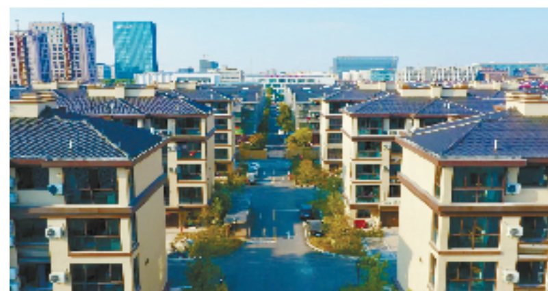
胡桥人才公寓外观

社企合作 打造1+1+N的管理模式 围绕小区人居环境及配套设施,东湖街道选择社区企业共管模式,引入