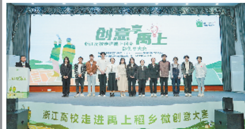
浙江高校走进禹上稻乡微创意大赛

10月23日,围绕打造“余杭城乡融合示范村、杭州共同富裕样板村、浙江未来乡村标杆村”目标,由杭州市余杭区委组织部人才办、杭州市余杭区余杭街道工作委员会主办,杭州稻香