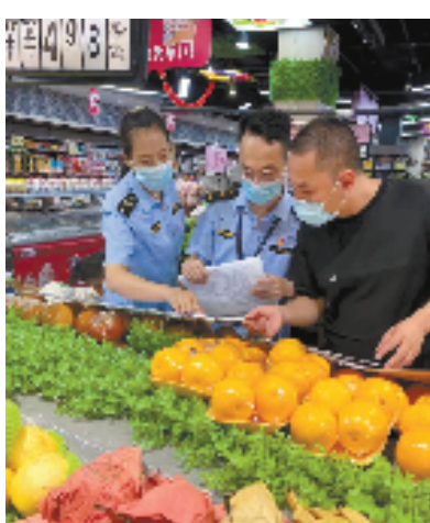
桐庐县市场监管局推进大型商超“赋码”工作