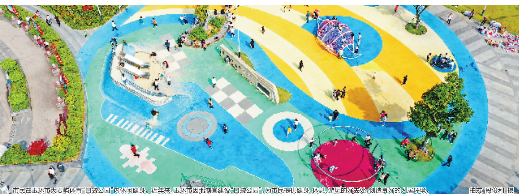
市民在玉环市大麦屿体育“口袋公园”内休闲健身。近年来,玉环市因地制宜建设“口袋公园”,为市民提供健身、休息、游玩的好去处,创造良好的人居环境。

未来,作为基层工作者,我们将在服务精细化上再下功夫,不断提升服务质量和水平,开好往返城乡的每一班车。