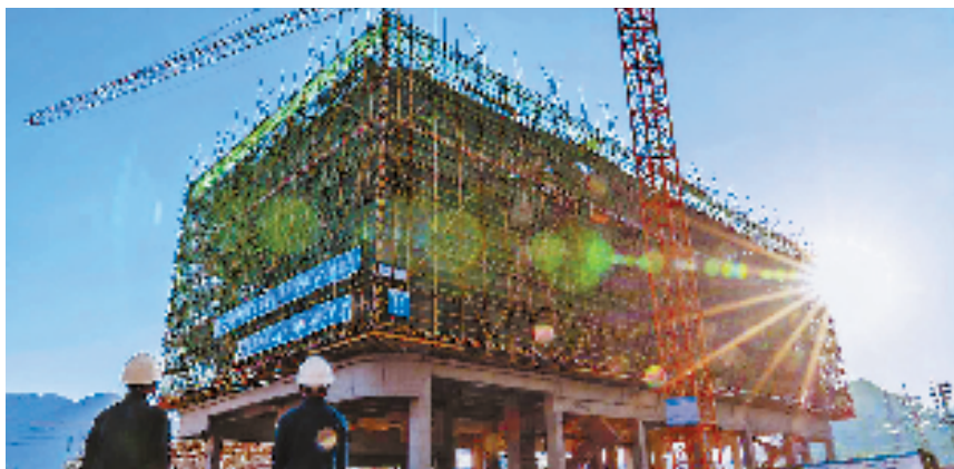
缙云现代数字农业产业园建设现场。

“党的二十大报告明确提出,着力解决好人民群众急难愁盼问题,这是德清改革精进不休的初心所在。”正在医院督