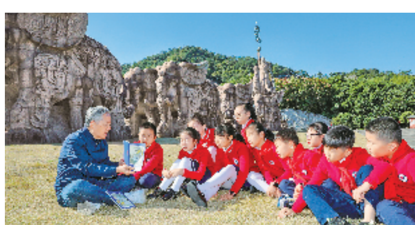
上虞学生在参加孝德文化研学游。

近年来,浙江交响乐团始终坚持以人民为中心的创作导向,不断探索创作具有浙江特色的原创作品:交响乐《唐诗之路》《社戏》《良渚》入选国家艺术基金;交响乐《诗路行·运河魂》入选省舞台艺术创作重点扶持项目;《祖国畅想曲》《大潮之上》入选“中国交响乐之春”展演、文旅部“时代交响——中国交响音乐作品创作扶持计划”等。