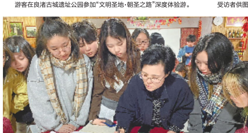
中国美术学院学生在下乡实践。

浙江交响乐团团长郭义江表示,乐团将在交响乐民族化和展现地域特色、时代风貌方面持续发力,用更多精品力作,积极展现浙江文艺风貌、传播浙江故事和浙江精神。