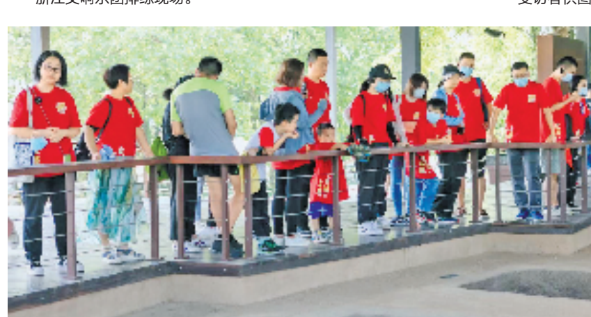
游客在良渚古城遗址公园参加“文明圣地·朝圣之路”深度体验游。