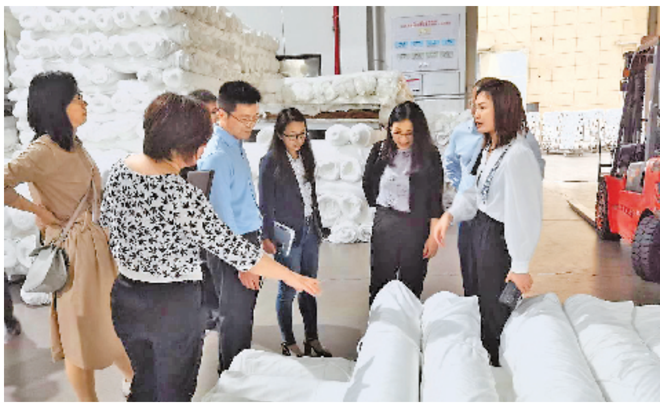
民生银行嘉兴分行走访海宁经编产业园区企业。

针对制造业企业设备更新和技术改造投资项目建设需求,该行已累计为先进制造业及产业升级类提供银团贷款支持70余亿元,2022年新增投放20余亿元;重点支持SY化工、SJ化工、ZL化纤、LJ新能源等银团项目,支持和帮助企业进行产业升级。