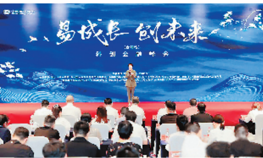
民生银行杭州分行在台州成功举办“易成长 创未来”科创金融峰会。

风华正茂恰少年,乘风破浪正当时。民生银行杭州分行将进一步扛起民生担当,勇立时代潮头,为实体经济提供高效、敏捷的金融服务,充分发挥服务民营企业、绿色经济、科创企业、中小微企业、乡村振兴新经济体的特色与优势,全力支持实体经济发展,在浙江这片创业创新的热土上,落脚于每座城市,为浙江“两个先行”贡献金融力量。