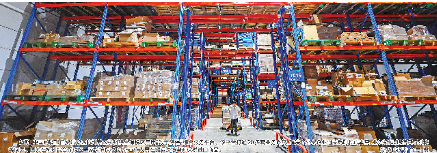
近期,中国(浙江)自贸试验区杭州片区杭州综合保税区启用“数字综保”综合服务平台。该平台打通20多套业务系统,解决了外贸企业通关耗时增长成本高、业务拓展难、信息不对称等问题。图为在杭州综合保税区一家跨境电商保税仓内,工作人员在搬运跨境电商保税进口商品。

党的二十大报告提出“增进民生福祉,提高人民生活品质”。自2021年全省启动数字化改革以来,下姜村村民的工作生活搭上了“数智”快车,比如利用5G远程会诊系统实现专家面诊,村民们在自家门口就享受到了优质的医疗资源。数字化改革以坚持人民至上、满足群众期盼为价值取向,改革成果具有普惠性。我们村尽管地处浙西山区,但很多高频的便民服务事项,大家点开“浙里办”APP就能办理,不用再跑到镇上或者县里。村民们点赞说,如今在浙江可以体验到未来生活。大家希望数字化改革能够创造更多全民共享、引领未来的成果。眼下,下姜村正在大力推进农村综合改革试点,加快未来乡村建设。我们会用好数字化改革红利,打造并完善“大下姜共同富裕数智平台”,让乡村发展后劲更足。