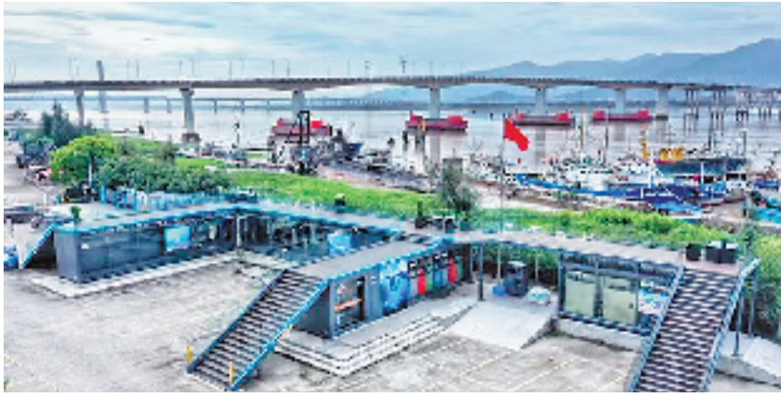
台州椒江码头边的船舶污染物无人化处置装置。

一直以来,衢州争当改革先锋,以数字化改革牵引各领域改革,“最多跑一次”改革、“县乡一体、条抓块统”改革、“大综合一体化”行政执法改革等成为全省标杆,连续两年入选全国营商环境标杆城市,探索形成系列体制机制新优势。特别是今年以来,衢州承担全省基层智治系统试点任务,通过建强基层智治大脑和事件中枢,推动省级重大应用贯通落地,更好为基层赋能;联动推进县级社会治理中心建设、乡镇模块化改革、基层管理体制综合改革等,迭代基层治理体系,着力探索数字化改革赋能下的基层治理基本功能、基本能力和基本模式。接下来,我们将以党的二十大精神为指引,一体推动全面深化改革、共同富裕示范区重大改革、数字浙江建设,奋力打造四省边际数字变革桥头堡,争取更多突破性进展、标志性成果,助推浙江打造全球数字变革高地。