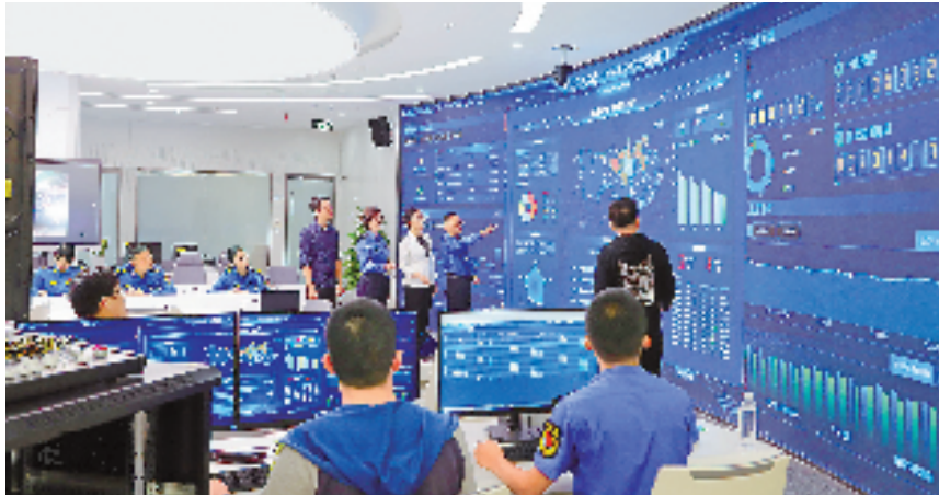
温州瓯海区行政执法统筹指挥中心,综合执法人员正在结合系统提供的AI综合分析报告进行研判处置。