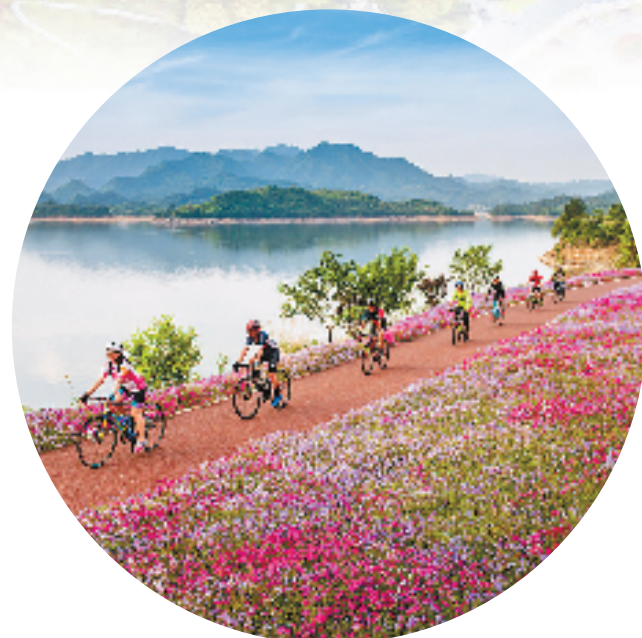
环湖绿道全面建成,“画里骑行”成为千岛湖休闲运动写照。

数据显示,2021年淳安县文旅经济发展水平与速度居全省前列,旅游产业增加值32.65亿元,占该县地区生产总值的12.79%,以旅游业为主导的服务业增加值占地区生产总值比重超60%。