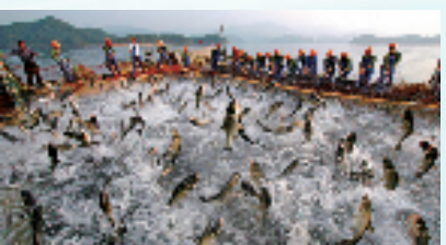
千岛湖捕鱼场景

“我们始终认为,环境保护与旅游发展休戚相关,要把环境保护当作旅游发展最强的生命线、旅游可持续发展的根基,绝不以牺牲环境为代价换取经济发展。用一句话来说就是:我为青山留净土,青山为我吐芬芳。”淳安县文化和广电旅游体育局局长方必盛说。