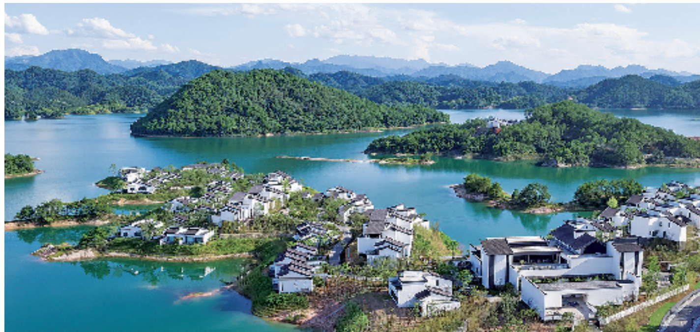
千岛湖的度假酒店

由于旅游业的发展,茂密的森林成了“摇钱树”,清澈的湖水成了“聚宝盆”。千岛湖的旅游产业规模在全国全域旅游领域处于领先。截至目前,全县共有22个A级景区,其中5A级景区1个;民宿农家乐1122家,床位1.9万张、餐位4.2万个,名列浙江省前茅。