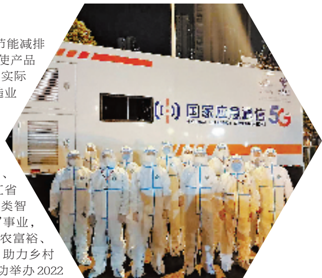
疫情防控,中国电信时刻在线。

在农业领域,浙江电信自主研发数字乡村云平台,打造标准化软件平台。平台融合云网、5G、物联网、视频等原子能力,以及浙江省行业能力平台,建设乡村各类智慧场景;致力于服务“三农”事业,自研浙里未来乡村在线、浙农富裕、浙里牧畜增产保供等平台,助力乡村振兴工作。浙江电信还成功举办2022数字乡村“金翼奖”活动,合力打造数字乡村十佳县(市、区)、十佳应用和百村优秀案例。