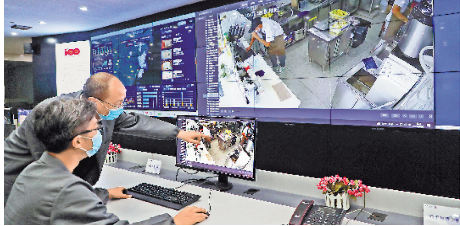
食品安全监管搭上数字化快车

同时,浙江电信建设了数据安全治理平台,引入了大数据、AI算法等技术,开发部署了数据资产管理、数据操作审计、风险发现、数据脱敏、数据防泄漏、数据安全评估等六大核心数据安全能力,为7个省级部门/中心以及11个市分公司赋能,提供多维度、跨部门、全流程的数据安全治理能力。