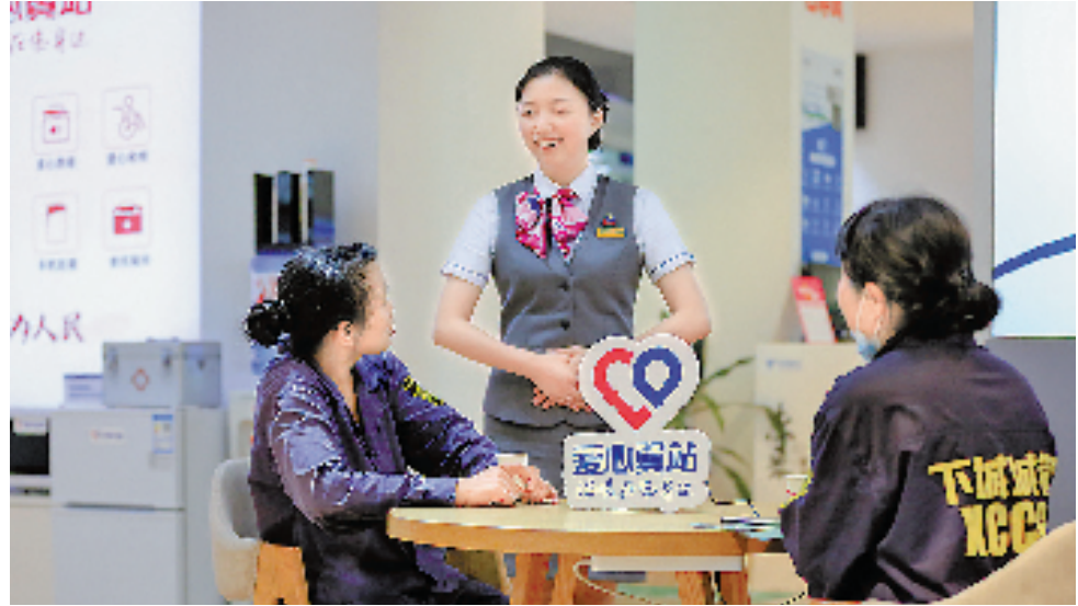
“爱心翼站”让户外劳动者处处有“家”

浙江电信实施数智随心、关爱随心、网络随心、消费随心、便捷随心、安全随心等“好服务更随心”六大服务举措,持续提升基础服务水平,全面满足客户信息需求,更快更便捷响应客户诉求;大力推进适老化服务,建成千家“爱心翼站”,开展幸福学堂超10000场、服务近10万人次,万号热线一键呼入老年客户260万人次,114适老生活服务60万人次。