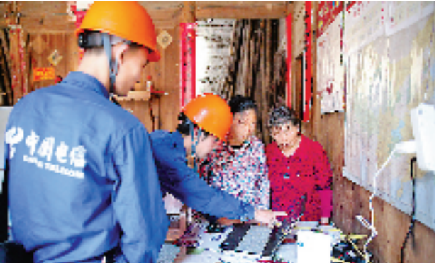
千兆宽带网络走进深山农家