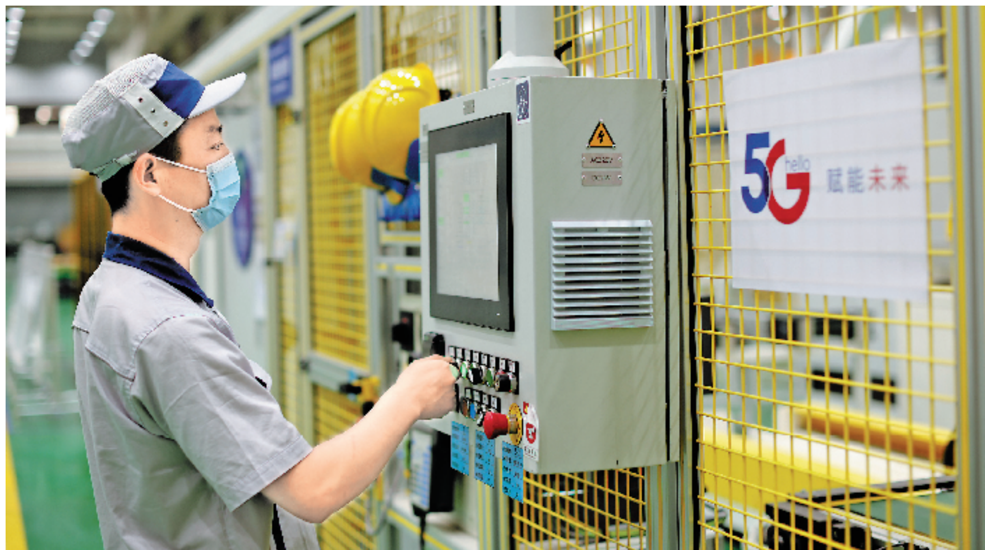
数字赋能5G未来工厂

打造算力高地。浙江电信主动承接“东数西算”工程,按照“4(区域中心)+11(城市中心)+X(边缘节点)”部署,初步形成省内“中心集群+浅边缘+深边缘”层次布局,启动杭州、嘉善大数据中心建设;衔接国家云建设,布局“天翼云”一城一池,打造分级部署、高速互联的分布式云,全域覆盖,实现泛在计算。