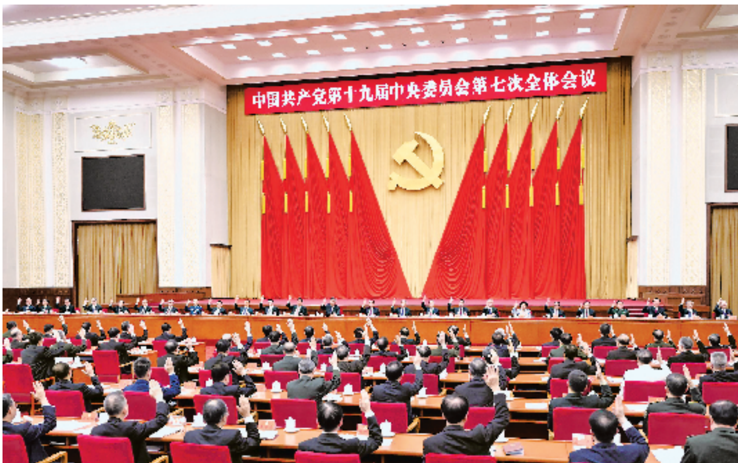
中国共产党第十九届中央委员会第七次全体会议,于2022年10月9日至12日在北京举行。中央政治局主持会议。

新华社北京10月12日电 中国共产党第十九届中央委员会第七次全体会议公报 (2022年10月12日中国共产党第十九届中央委员会第七次全体会议通过) 中国共产党第十九届中央委员会第七次全体会议,于2022年10月9日至12日在北京举行。出席全会的中央委员199人,候补中央委员159人。中央纪律检查委员会委员和有关负责同志列席会议。全会由中央政治局主持。中央委员会总书记习近平作了重要讲话。 全会决定,中国共产党第二十次全国代表大会于2022年10月16日在北京召开。 全会听取和讨论了习近平受中央政治局委托作的工作报告。全会讨论并通过了党的十九届中央委员会向中国共产党第二十次全国代表大会的报告,讨论并通过了党的十九届中央纪律检查委员会向中国共产党第二十次全国代表大会的工作报告,讨论并通过了《中国共产党章程(修正案)》,决定将这3份文件提请中国共产党第二十次全国代表大会审查和审议。习近平就党的十九届中央委员会向中国共产党第二十次全国代表大会的报告讨论稿向全会作了说明,王沪宁就《中国共产党章程(修正案)》讨论稿向全会作了说明。