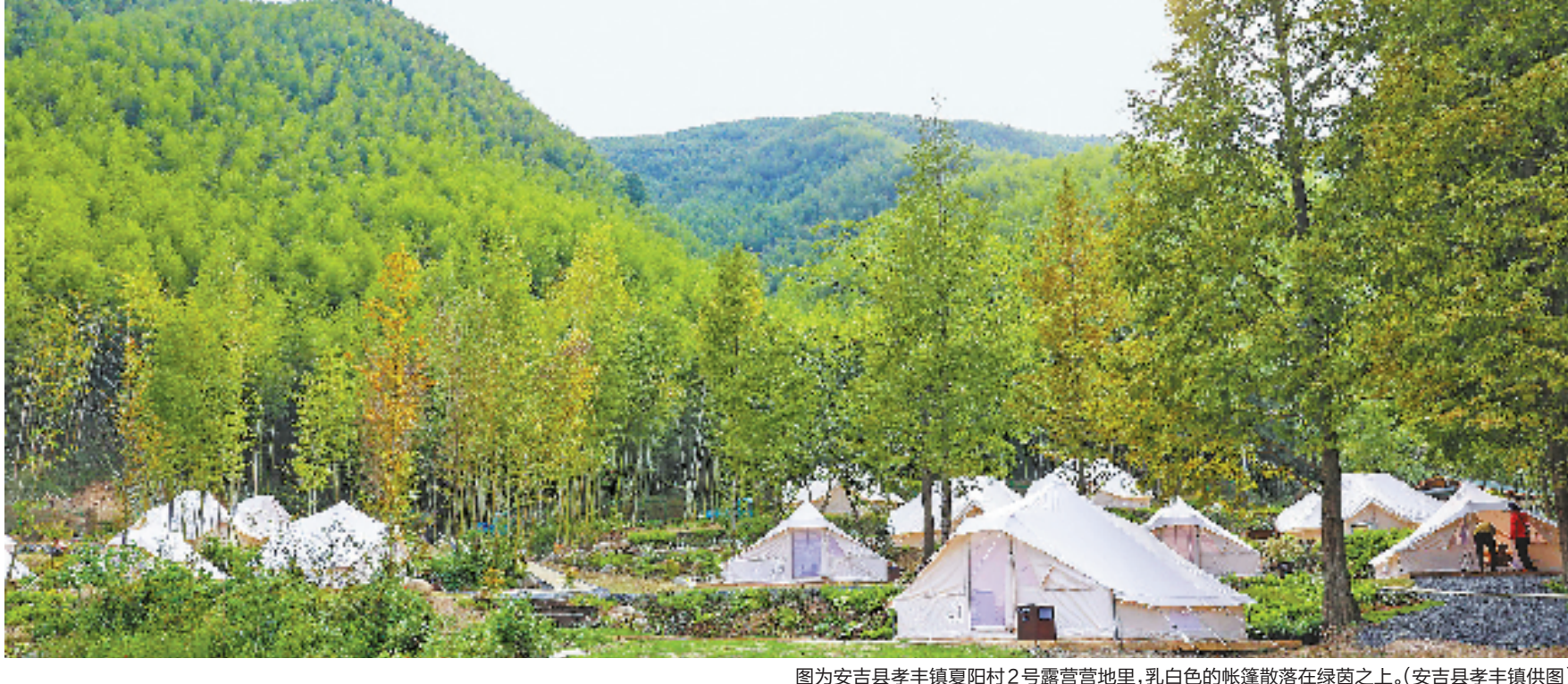
图为安吉县孝丰镇夏阳村2号露营地,乳白色的帐篷散落在绿茵之上。

党的十八大以来,面对我国异常严峻的生态环境形势,习近平总书记不断地在认识自然、认识人类、认识人与自然的关系上作出深入探索,提出并阐述了“坚持人与自然和谐共生”“山水林田湖草沙是生命共同体”“良好的生态环境是最普惠的民生福祉”“用最严格制度最严密法治保护生态环境”“共谋全球生态文明建设之路”等一系列论断。特别是将绿水青山就是金山银山理念丰富和发展为“我们既要绿水青山,也要金山银山。宁要绿水青山,不要金山银山,而且绿水青山就是金山银山。”这就旗帜鲜明地阐述了三个论断:兼顾论,在可能的情况下兼顾环境保护和经济发展;优先论,在难以兼顾的情况下坚持“生态优先”;转化论,努力构建生态产品价值实现机制。2018年,全国生态环境保护大会正式提出习近平生态文明思想。这是民心所向和党心所向,这是时代所需和社会所需。