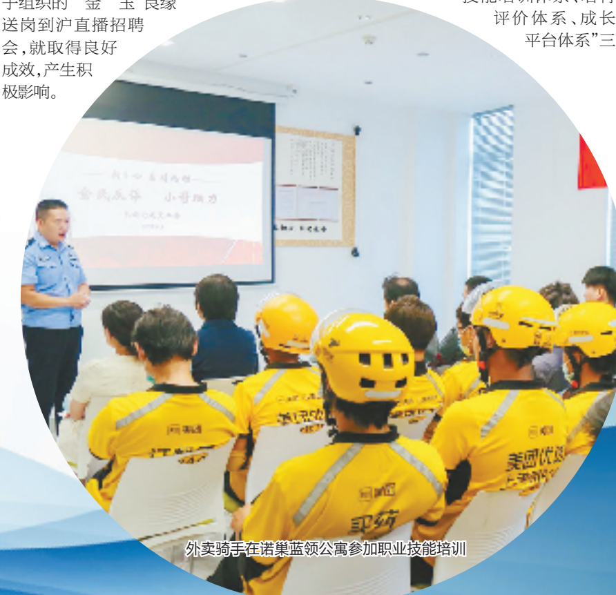
外卖骑手在诺巢蓝领公寓参加职业技能培训

接下来,上城区计划三年内在辖区招募500名左右具有绝技绝活和技能拔尖的技能工匠成为联盟成员,并面向不少于1000家企业开展技术攻关、技术创新、带徒传技活动,推动全区技能大师和劳模工匠聚“线”成“网”。