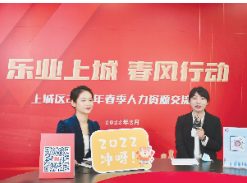
上城区2022年春季人力资源交流会

校毕业生等青年亟需“阳光雨露”精准指引。2021年以来,上城区新引进青年大学生4.1万人。“我们坚持把青年大学生就业作为重中之重,加大社保医保政策宣讲、就业管理服务保障、劳动权益维护等工作力度,多渠道