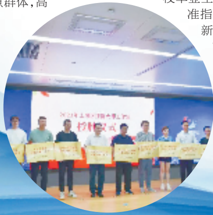
2021年上城区技能大师工作室授牌