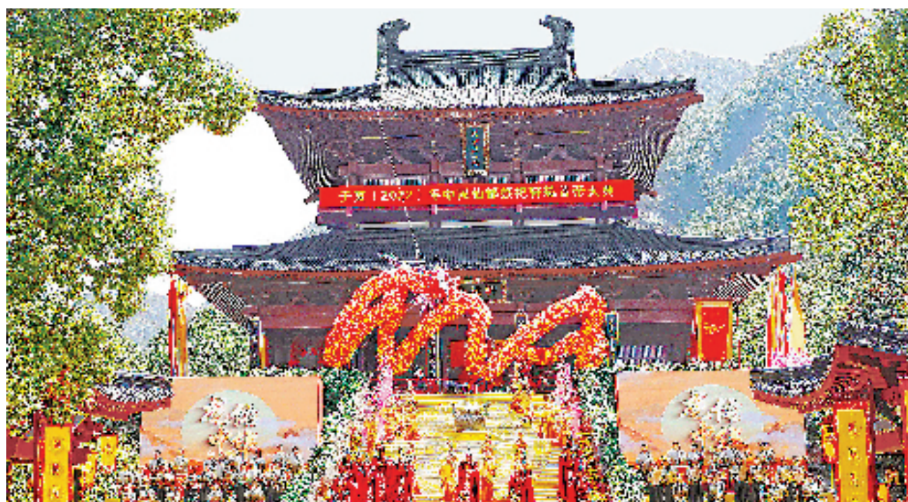
10月4日,农历重阳节,壬寅(2022)年中国仙都祭祀轩辕黄帝大典在缙云仙都景区黄帝祠宇举行。

今年是仙都黄帝祭典主办单位变更为浙江省政府的第二年,较之去年,仪式更加凸显浙江辨识度和时代特色。祭典的“高唱颂歌”环节由去年的三声部增至八声部,增强了颂歌的雄壮与威仪;“乐舞告祭”环节,新添礼乐仪仗,提升了祭典质感。 祭典舞总导演、浙江歌舞剧院总导