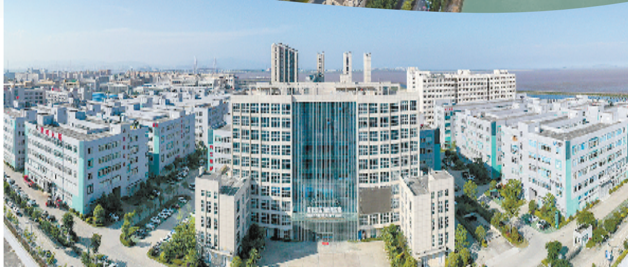
瑞安阁巷高新产业小微园