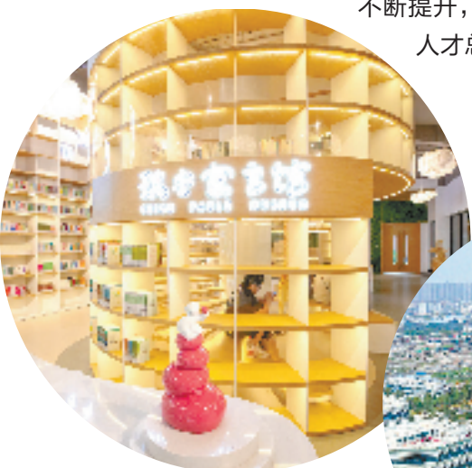
瑞安寓言馆内场景

瑞安更青春、更幸福——过去十年，率温州之先启动儿童友好型城市创建，加快推进青年发展型、老年友好型城市建设；城市吸引力不断提升，“七普”人口增加10万人，人才总量连续3年居温州第一。