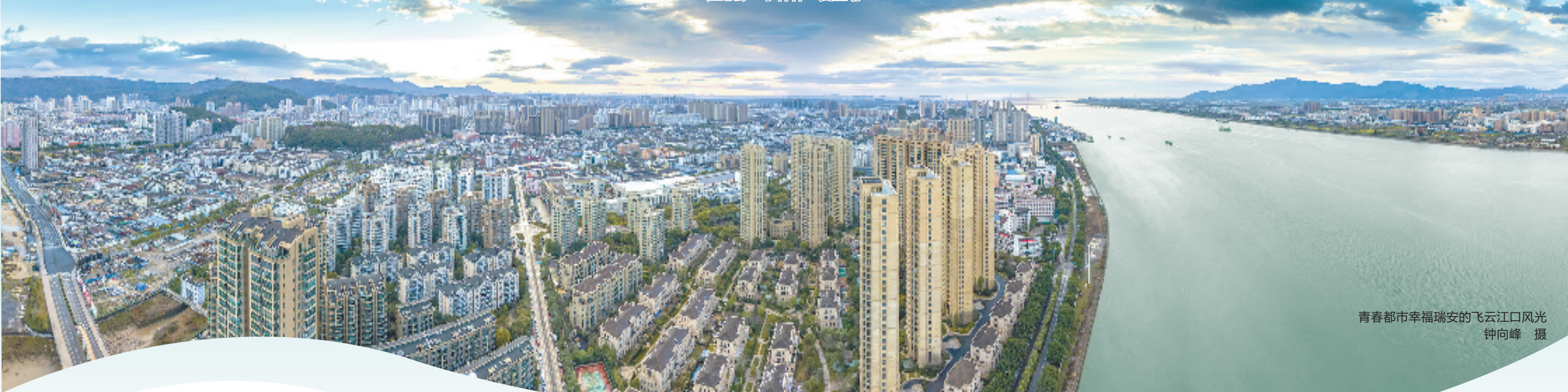
青春都市幸福瑞安的飞云江口风光

青春都市，幸福瑞安。瑞安这座千年古县，在青春蝶变中追逐幸福。瑞安更强、更大了——过去十年，地区生产总值由559亿元增加到1149亿元，成为全省第7个地区生产总值破千亿元县市；创新指数进入全省第一梯队，位列全国科技创新百强县市排名第14位。