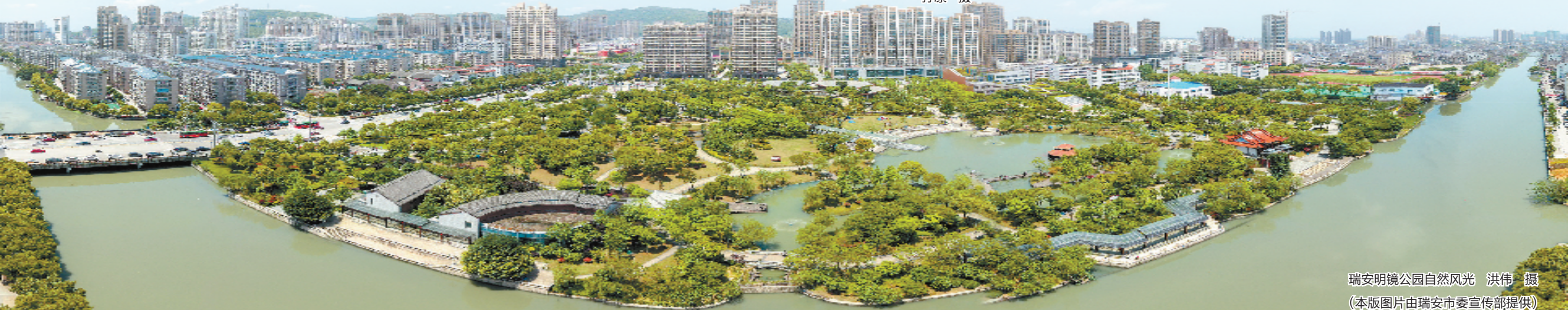
瑞安明镜公园自然风光

科技创新的关键是人才。瑞安聚力打造“近悦远来”的人才生态：持续迭代菁英人才、养育津贴等人才新政，实施高校毕业生招工“510计划”攻坚行动，高规格举办世界青年科学家峰会瑞安分会、“百名博士家乡行”等活动，全域布局人才咖啡、人才夜市等特色场景，现在两大院士团队、1100名高层次人才、1.2万名各行业精英正在瑞安创新创业，人才资源总量超31万人，连续多年位居温州第一。