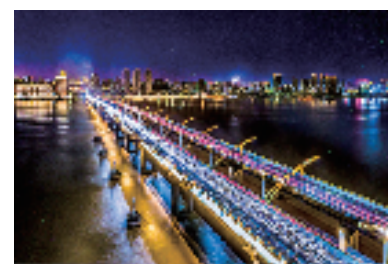
飞云江上姐妹桥夜景

让民生幸福这一“鲜明底色”成为瑞安高质量发展的“最大特色”。实施“富民享十惠行动”，解决群众“急难愁盼”问题，近十年民生支出占公共财政支出比重达77.4%，创新构建中提低“一库一箱一单一案”，全国体量最大的县级图书馆开工建设，城市书房、文化礼堂遍布城乡，人均体育场地面积增长了2倍，建成了30分钟文化圈、15分钟健身圈。