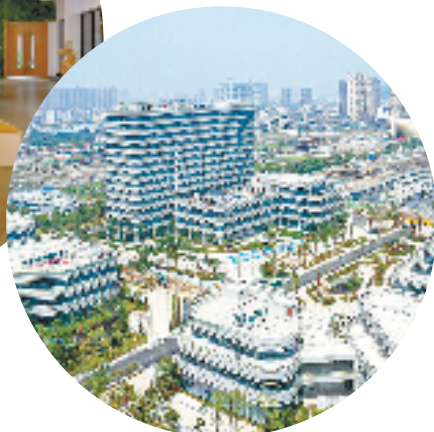
瑞安东新城科创园