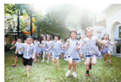
探索推广公益幼儿园办园模式