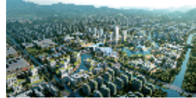
瑞安塘下“万亩千亿”平台综合服务港效果图

产业链现代化，持续擦亮“中国汽摩配之都”等16张国字号经济金名片，建成五大省级工业互联网平台，培育国家级专精特新“小巨人”企业25家、单项冠军企业5家、隐形冠军企业6家，数量均居全省前列；落地百亿级华峰可降解新材料等一大批重大制造业项目，累计开工18个省“152”工程项目，加快打造千亿级新能源智能网联汽车及部件、500亿级智能装备、500亿级新材料、500亿级时尚轻工、300亿级数字经济、100亿级生命健康产业集群。