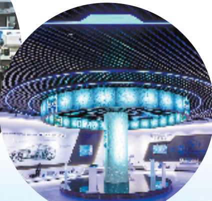
数字化助推瑞安产业转型升级