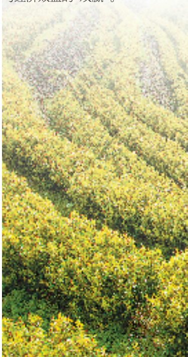
缙云黄茶基地

仙都与青喜坊、西冷印社等知名文创企业合作,深入挖掘黄帝文化等内涵,以“把仙气带回家”为主题,开发了90多种文创产品,并在景区开设第一家文创直营店,实现社会效益与经济效益的“双赢”。