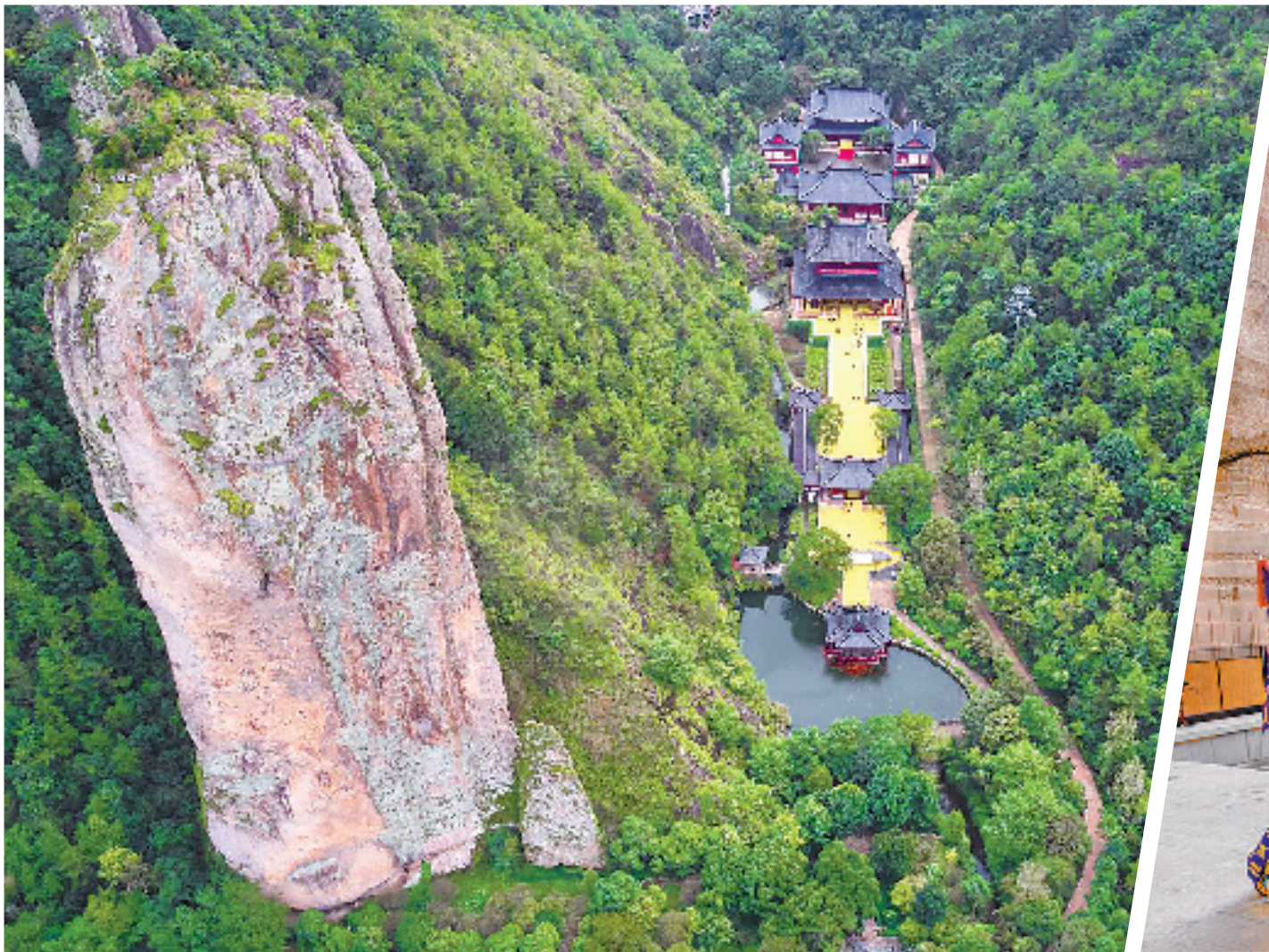
黄帝祠宇

而对游客来说,进入“祭典在线”则可以更贴近现场,进行云端祭祀,感受祭祀黄帝作为国家级非物质文化遗产的传承性和庄严性。