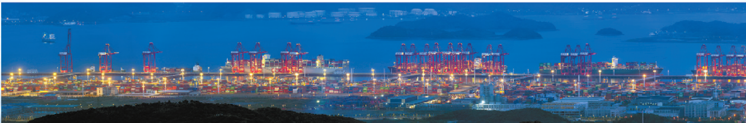
相锦文 | 梅山港全景(局部)

从福泉山俯瞰，夜幕下，岸线总长4400米的宁波舟山港梅山港区尽收眼底，灯火璀璨、气势恢宏。此照利用500mm长焦效果，由16张照片拼接而成。