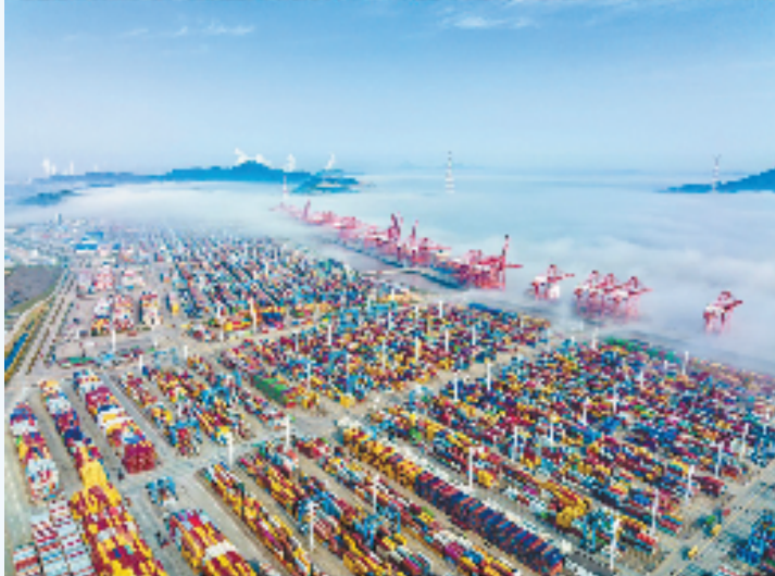
汤健凯 | 大港奇观

2022年4月8日，宁波舟山港穿山港区平流雾降临，云雾弥漫在桥吊、集装箱和巨轮之间，呈现出仙境般的奇观美景。