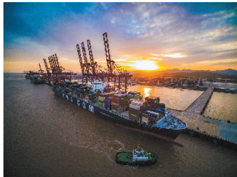
胡锦涛 | 晚霞映雄姿

宁波舟山港梅山港区，蓝天碧水，白云悠悠，梦幻空灵。色彩鲜艳的吊机矗立于此，似大地之纽带，在广阔浩大、和谐美丽的自然间，展示着人类的智慧和力量。