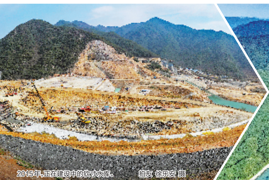
2015年,正在建设中的钦寸水库。

从上世纪90年代开始,作为缺水城市的宁波为“解渴”谋划境外引水工程。与此同时,山地丘陵多、局部暴雨山洪多的绍兴新昌,面临着水患的困局。2010年9月,总库容2.44亿立方米的钦寸水库项目正式启动,新昌县和宁波市按51:49的投资比例合作建设。2020年6月19日,钦寸水库正式向宁波开闸供水。