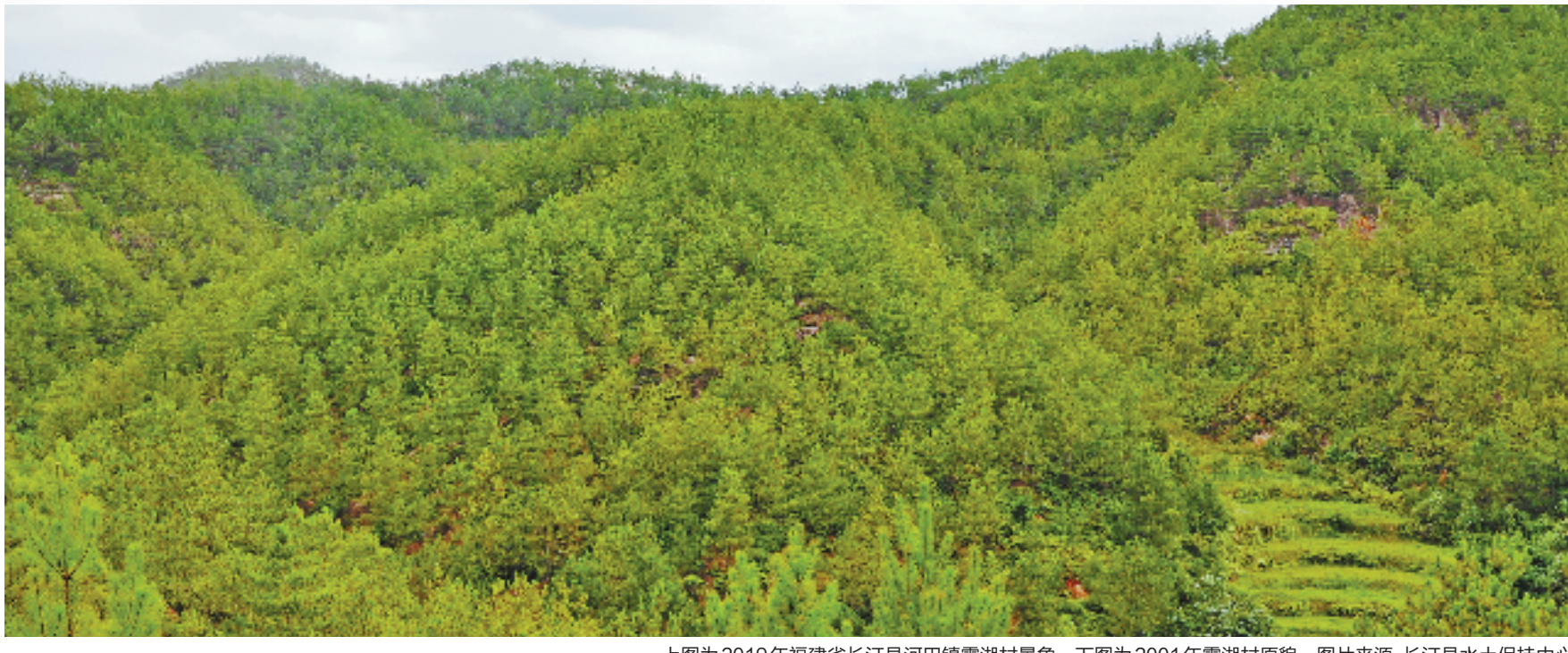
上图为2019年福建省长汀县河田镇露湖村景象。下图为2001年露湖村原貌。

主政福州之后,习近平同志大力推进“绿化福州”和内河综合整治行动,针对前者,提出了“抓重点、保基础、上水平、一体化”的工作思路,要求将“见缝插绿”和“成片种树”策略相结合;针对后者,制定出台了《城区内河污染综合整治规划》和“全党动手、全民动手、条块结合、齐抓共治”的治水方略。如今,福州的生态环境质量稳居全国前列。