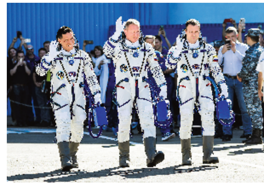
9月21日,在哈萨克斯坦境内的拜科努尔发射场,来自俄罗斯的宇航员谢尔盖·普罗科皮耶夫(中)、德米特里·佩捷林(右)和来自美国的宇航员弗朗西斯科·鲁比奥亮相。

新华社莫斯科9月21日电 俄罗斯国家航天公司21日说,俄“联盟MS-22”飞船当天与国际空间站完成对接,2名俄罗斯宇航员和1名美国宇航员顺利进入国际空间站。