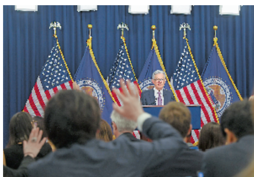
9月21日,美国联邦储备委员会主席鲍威尔在华盛顿出席新闻发布会。

于激进,对政策滞后影响考虑不足,可能导致失业率上升。根据季度经济预测,美联储官员对2023年第四季度美国失业率的预测中值为4.4%,较6月预测上调0.5个百分点。美联储官员对今年第四季度国内生产总值(GDP)同比增速的预测中值为0.2%,明显低于6月预测的1.7%,更低于3月预测的2.8%,体现出他们对美国经济前景的预期更为悲观。