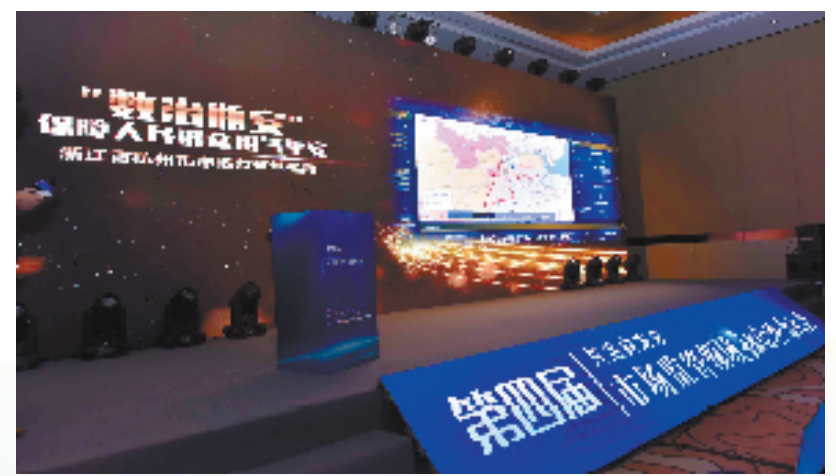
“数治瓶安”荣获第四届市场监管领域社会共治大会政府类十佳案例榜首