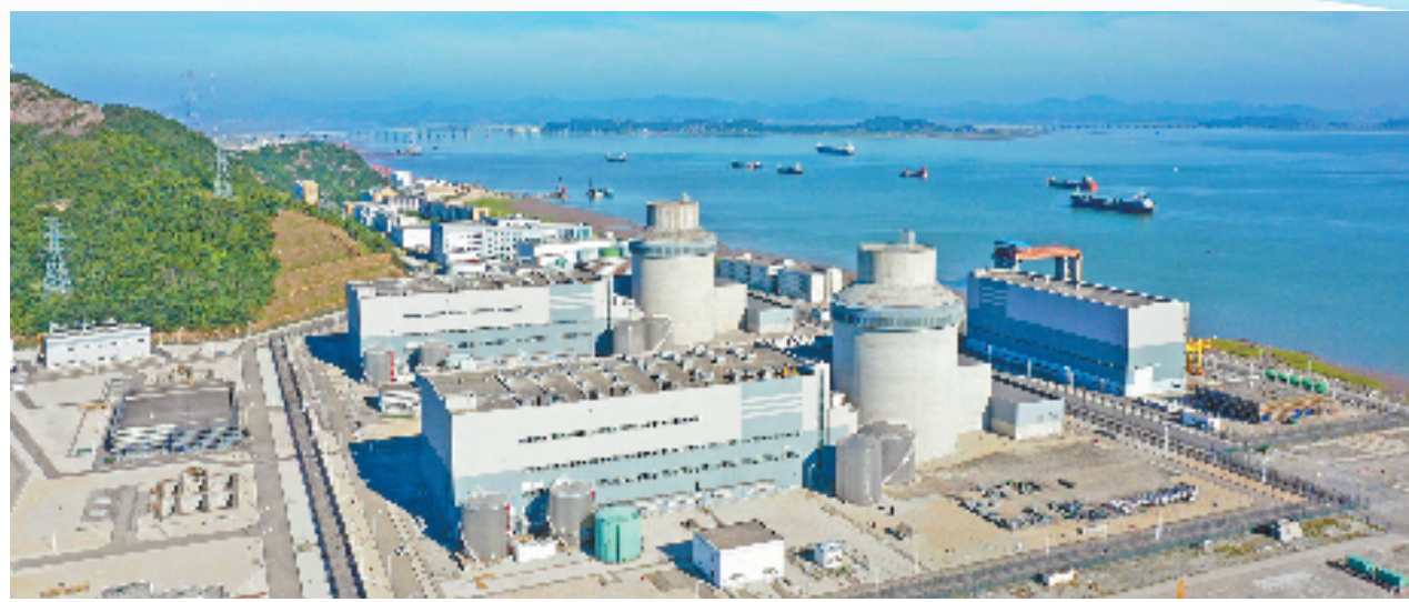
三门核电全景

三门湾畔，海天交接处，一颗璀璨“明珠”熠熠生辉。三门核电坐落在台州市三门县健跳镇猫头山半岛，有序整洁的厂房拔地而起，源源不断地向千家万户输送着清洁能源。