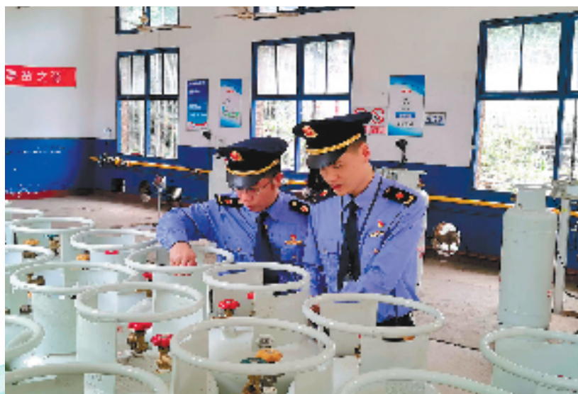
杭州市市场监管部门指导充装单位从充装源头开展“数治瓶安”建设