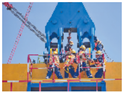
三门核电3号机组现场施工前吊具检查

9月19日，直径近40米、整体起吊重量达811吨的三门核电3号机组钢制安全壳封头顺利完成吊装，这是3号机组核岛反应堆厂房吊装的首个大型模块，拉开了三门核电二期3号机组核岛（核反应堆）厂房建造高峰的帷幕。