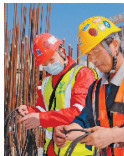
三门核电一线工人战高温、保工期