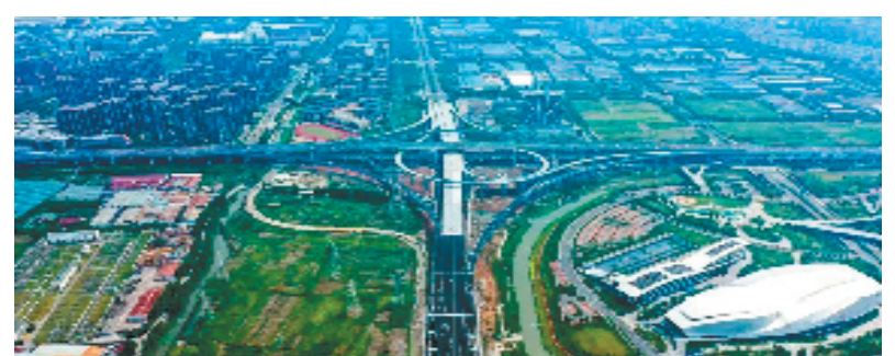
宁波环城南路西延

十年治堵,久久为功。就在本月,宁波市治堵办精心策划,推出了“治堵十年·绿色出行让生活更美好”图文征集活动,向广大市民网友征集新老摄影作品、文章。据悉,目前该活动正在征集阶段,后续将评选出一批优秀作品,来集中展示宁波十年治堵的历程。