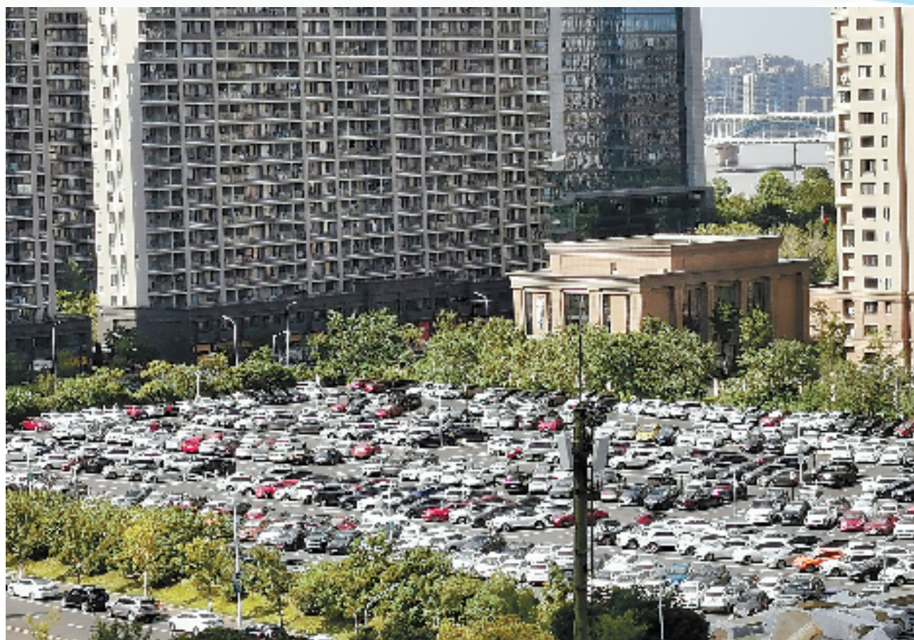
浙大儿院滨江院区地面临时停车场

为缓解就诊“停车难”,2011年以来,杭州市通过“规划、建设、引导”配套组合,强化利用临时用地、出让用地增建、单位利用自有用地加建等方式增加区域停车位,全力推进医院周边的公共停车场建设。截至2022年8月,医院周边公共停车场累计建成35个,泊位数近7000个,极大地缓解了停车压力,医院周边的交通逐渐有序化,助力杭城治堵保畅。