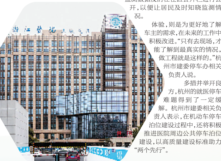
芦荡公园地下公共停车场的出入口就在浙江医院三墩院区对面

多措并举开良方,杭州的就医停车难题得到了一定缓解。杭州市建委相关负责人表示,在机动车停车位建设过程中,还将积极推进医院周边公共停车位建设,以高质量建设标准助力“两个先行”。