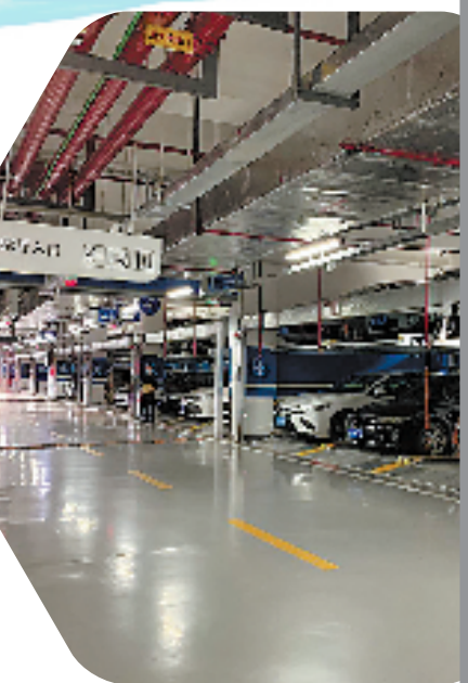
省妇保医院南侧公共停车场

在上城区景芳园地下公共停车场建设中,就有居民担心,施工是否会影响到周边房屋安全,可能占用公园绿化。为此,停车场建设方案将原本破旧的景芳园统一进行提升改造,以满足当地