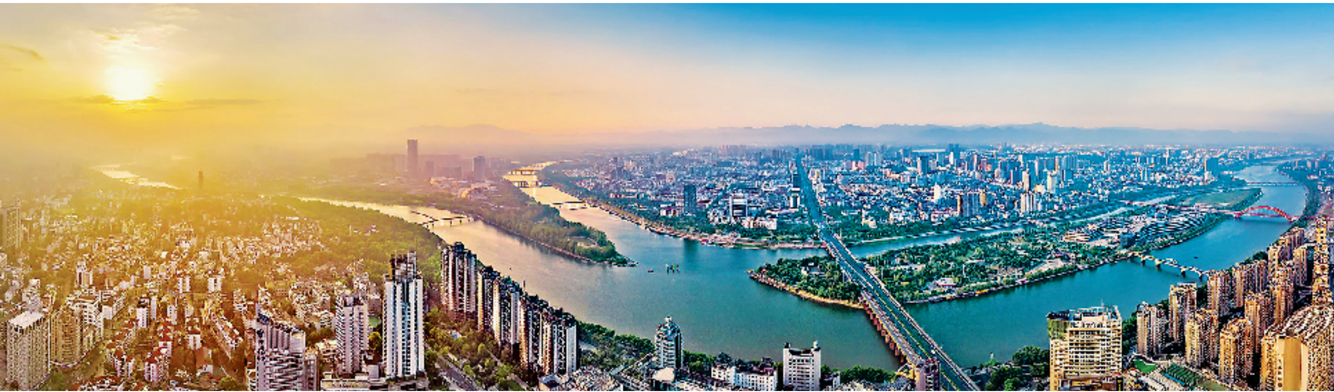
俯瞰金华城区。