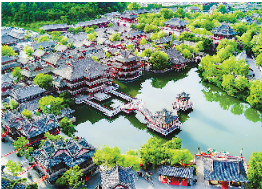
东阳横店影视城清明上河园景区。

都市区共建的最终落脚点在于百姓得实惠。眼下,金义新区、义乌、浦江境内的15个高速收费站进入“高速免费通行圈”,市民共享这一民生红利;都市区西部联网供水工程建成通水,中部联网供水工程顺利推进,水资源共享一盘棋格局正加快构建;社保业务、医保报销等实现全市互联互通,高频事项全市通办率达100%，“八婺同城、市县互通”政务服务品牌越来越响。