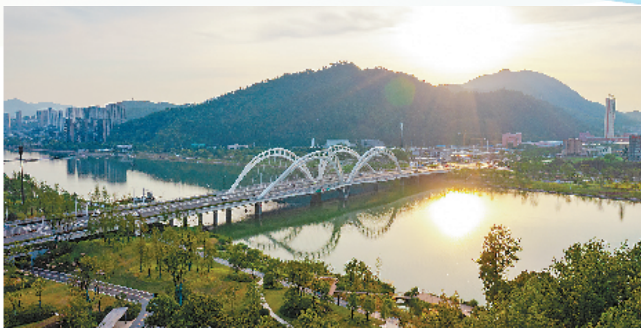
崭新的公望大桥横跨在北支江上