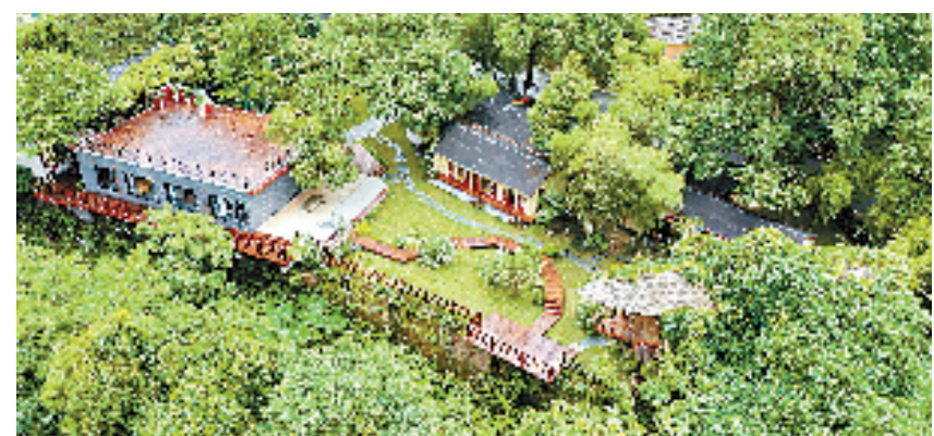
黄公望村公望两岸圆缘园

接下来，东洲街道还将全力以赴，厚植美丽乡村生态底色，把《富春山居图》中的文化愿景和意境“复原”到东洲山水之中，让“生活富裕、生命阳光、生态美丽”“三生”融合，打造可看、可游、可居、可业的现代版“富春山居图”画卷样板段。