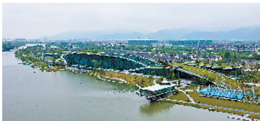
富阳水上运动中心亚运场馆