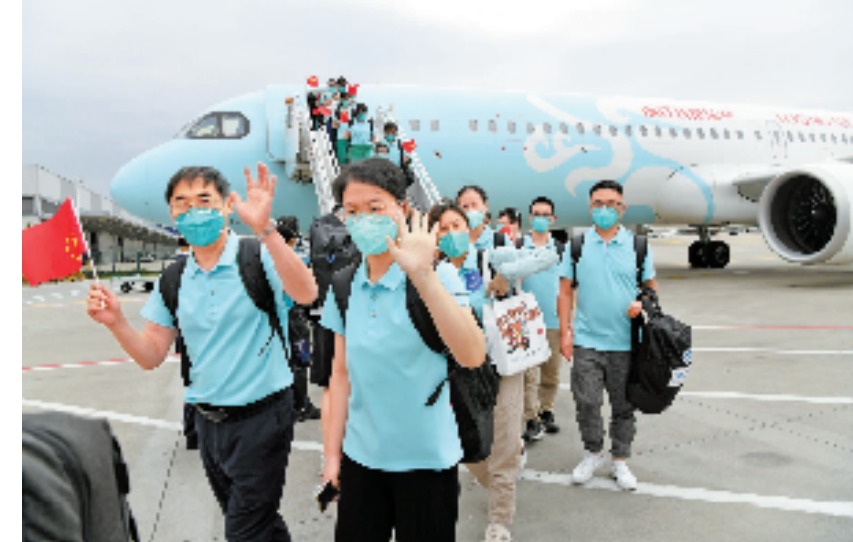
9月5日下午,浙江援琼重症救治医疗队抵达杭州萧山国际机场。

本报杭州9月5日讯(记者 陈宁 见习记者 林晓晖)千里之外,浙江“战队”再显担当。经历25天战“疫”后,浙江援琼重症救治医疗队圆满完成返浙任务,5日下午乘机返回浙江。