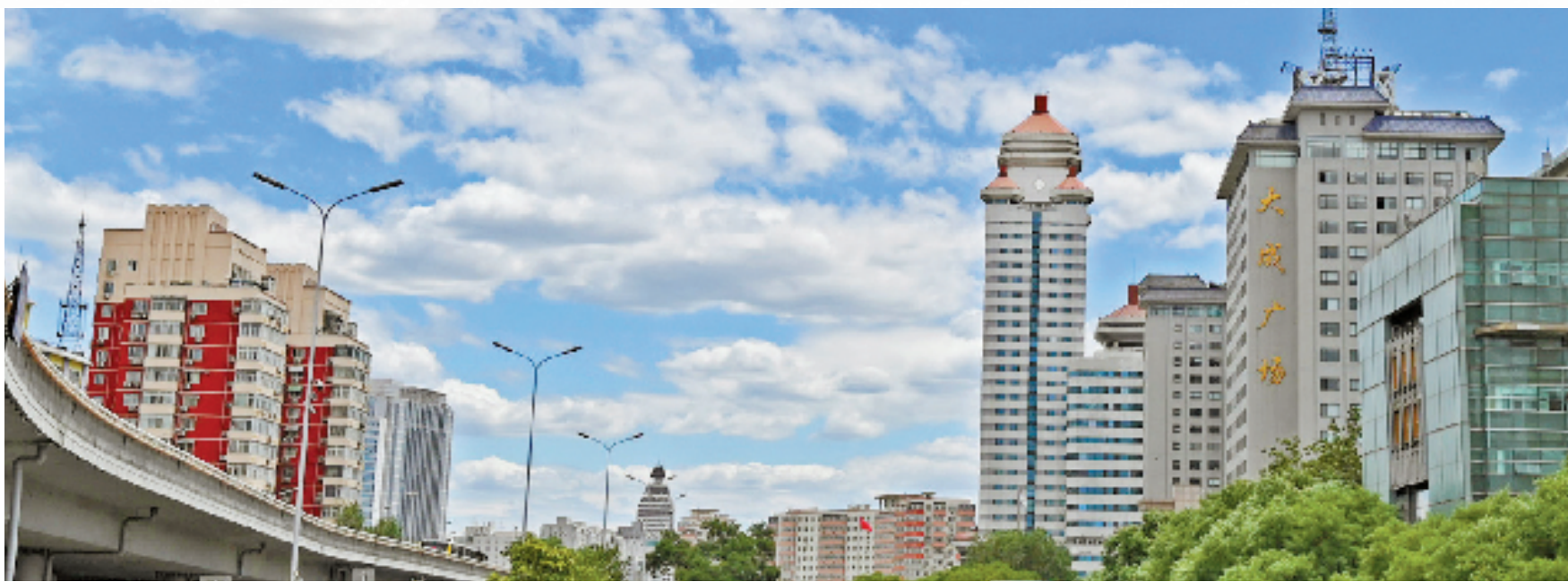
上图为2022年6月6日北京西二环一座立交桥附近的街景。下图为2013年1月11日同一地点所摄。