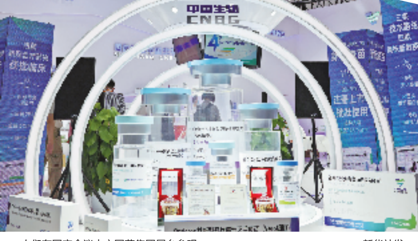
人们在国家会议中心国药集团展台参观。