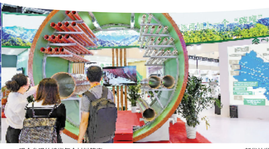
观众参观竹缠绕复合材料管廊。