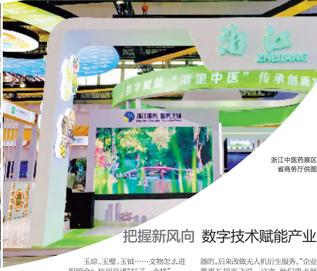
浙江中医药展区