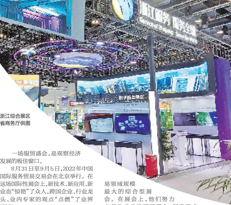
浙江综合展区