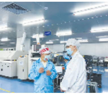
嘉兴经开区税务干部走访企业，宣传税收政策，了解企业困难和需求。

“我局将持续把税收优惠政策送到每一个市场主体手中，用惠税政策、便民服务的‘减法’换取企业发展壮大的‘加法’、市场活力倍增的‘乘法’。”国家税务总局嘉兴经济技术开发区税务局党委书记、局长陈望星说。