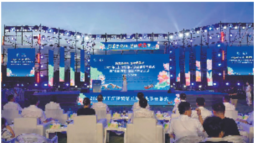
秀洲区王江泾镇第五届荷花节开幕

今年上半年，王江泾镇加快湿地公园项目建设，莲泗荡水上游憩项目湿地景观提升工程已完成60%。未来，王江泾镇还将进一步提升莲泗荡景区环湖绿道的景观风貌及丰富休闲度假消费业态，重点推进千里集运河文化创意园、琵琶岛生态农业园等项目建设，深入挖掘运河文化价值，打造出一批具有市场吸引力的文旅精品项目，擦亮嘉兴运河文化金名片，进一步实现文旅融合发展。