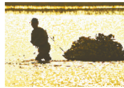
莲藕成熟季，藕田里一幅热火朝天的劳作景象。

江南可采莲，莲叶何田田，鱼戏莲叶间。在嘉兴市秀洲区，有一个地方，因万亩荷塘、千亩荷花闻名，是嘉兴及周边地区赏荷人士每年都要打卡的去处。