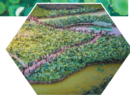
千亩荷塘成为秀洲区王江泾镇夏日乡村游的亮丽风景线

涝灾害，而且全身都是宝，不仅荷花具有观赏价值，荷叶之下的莲藕还有食用和药用价值。莲藕的经济效益让许多村民也纷纷走上种植之路，促成了王江泾镇“万亩荷塘”“千亩荷花”的壮美景观。