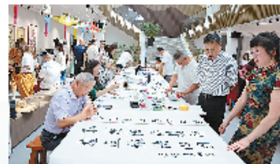
南浔区善琮司法所结合当地湖笔文化，举办“法治伴我行”书画现场创作大赛。

此外，针对社区矫正对象，善琮司法所设置了心理咨询室，邀请国家二级心理咨询师定期坐诊，为社区矫正对象开展心理咨询和心理干预，帮助他们重新塑造健全的人格。