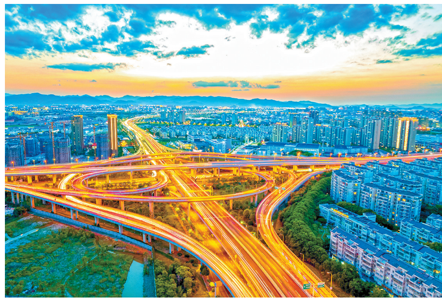
宁波加快打造城市快速路网体系

各项目标既成系统,又有分类引导。针对社会治理的先行示范,宁波提出加快基层治理系统建设,深入推进市域社会治理,统筹实施“法助共富、法护平安”专项行动等10项重点工作。针对公共服务优质共享先行示范,宁波要求推进教育、卫