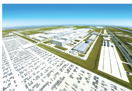
上汽大众宁波分公司

经济监测晾晒机制,实施八大领域30多项高频指标日监测、周汇总、月分析,开展稳进提质指标周晾晒周监测。创新指标目标统筹机制,根据形势变化和实际运行情况,滚动提出各地各部门目标任务,引导各方盯目标、谋措施、强落实。创新经济运行协调推进机制,组织开展一季度“开门红”集中攻坚行动,针对疫情影响及运行中出现的新情况新问题,会同各地各部门抓好形势研判分析,协同推进问题解决,力促经济回升向好。