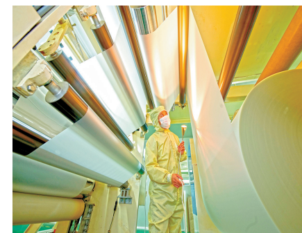
宁波数智科技新生产线

关键项目牵一发而动全身。宁波市发改委根据任务指标,为项目量身定制服务方案。为推动重大项目建设,宁波实施市领导牵头重大项目集中攻坚,对50个重大项目落实“一项目一方案一专班”,强化要素保障和协调服务力度。加快推进镇海炼化、吉利总部、旗滨光伏等重大项目。对省“4+1”重大项目,倒排新建项目开工时间节点,全力促开工促放量。1月至7月,420个市重点工程建设项目共完成投资1218.7亿元,完成年度计划的74.3%。