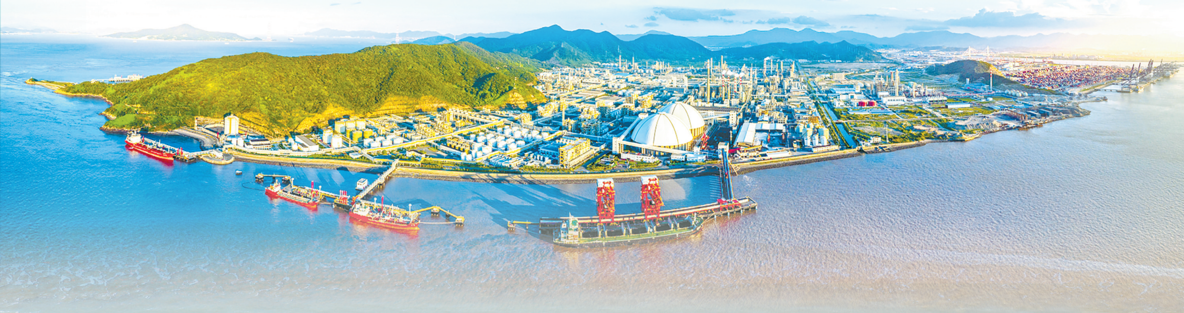
宁波大榭开发区新貌