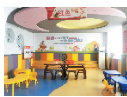
白云街道红色直播间