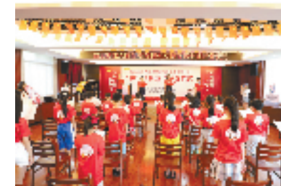
大陈岛垦荒精神实践营开业仪式