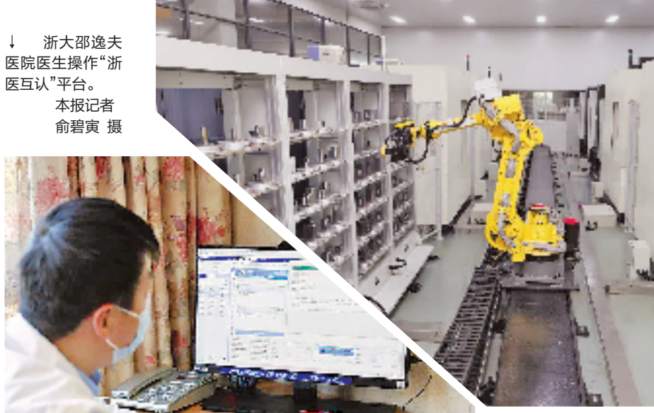
浙大部逸夫医院医生操作“浙医互认”平台。

据悉，全省已累计上架产业大脑相关组件近500个，其中262个已运用到企业生产经营等各个场景，累计调用超200万次。今年以来申报未来工厂建设的企业达到1750余家，增长了数倍。省级智能工厂、未来工厂企业平均生产效率提高54%，市场主体参与数字化的积极性显著提升。