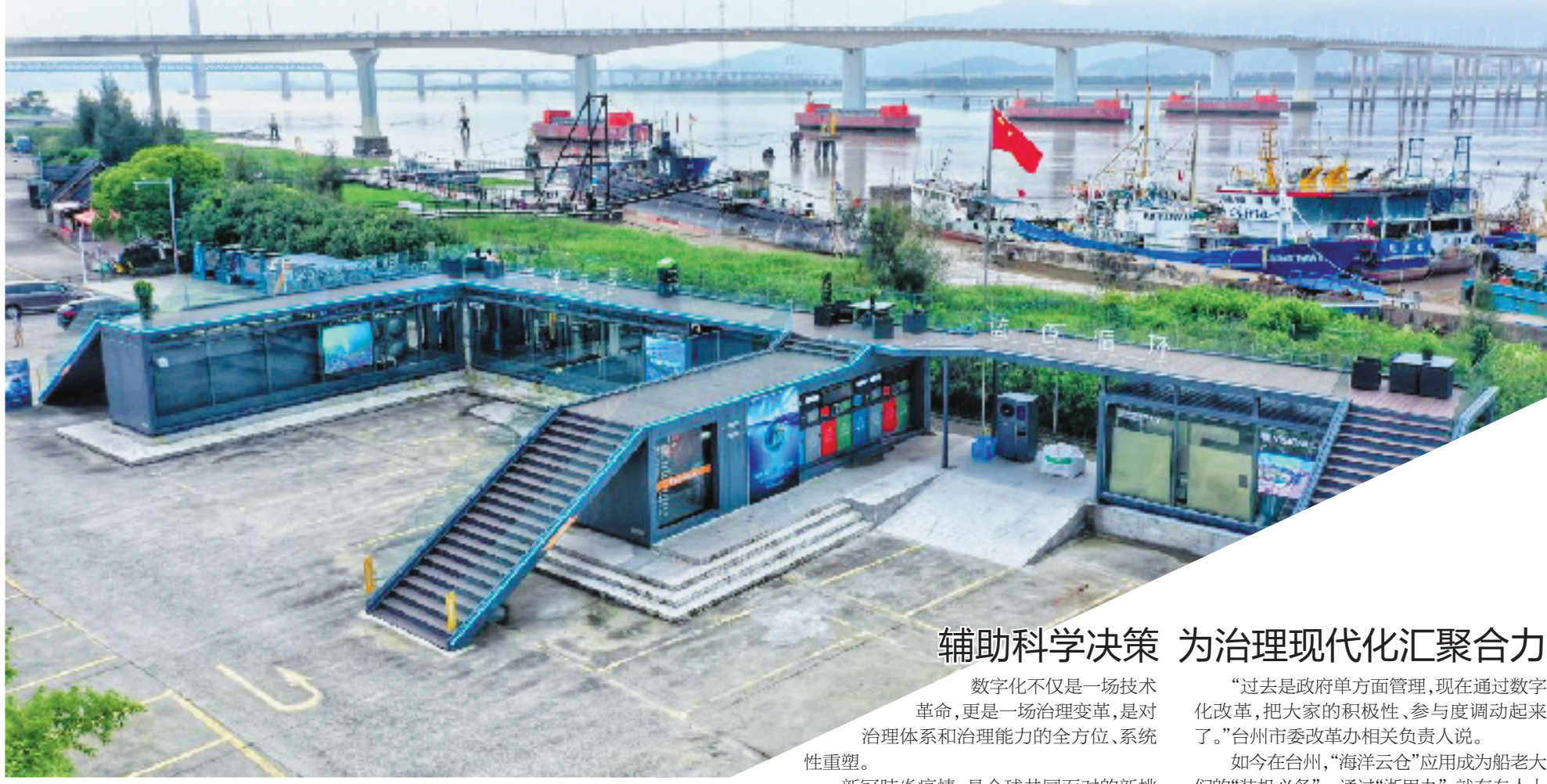
储存船舶污染物的“海洋云仓”。

“疫情要防住、经济要稳住、发展要安全”，在努力实现多重目标的动态平衡中，数字化改革，正成为浙江积极应对风险挑战的“关键一招”。