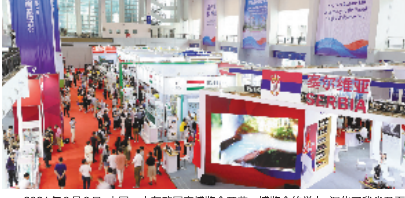
2021年6月8日,中国—中东欧国家博览会开幕。博览会的举办,深化了我省乃至全国与中东欧国家在贸易、投资、人文等方面的交流合作。本报记者 吕之遥 贺元凯 摄