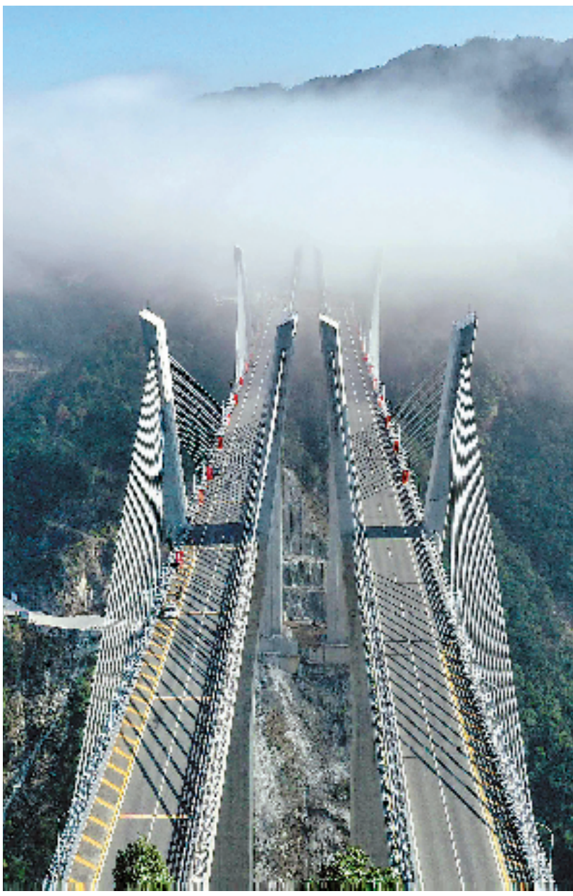
2020年12月22日,文泰高速全线开通,这标志着浙江陆域实现“县县通高速”。

这些年,浙江坚持以加强党的全面领导和全面从严治党守好“红色根脉”,为打造新时代党建高地和清廉建设高地奠定了坚实基础。(本报记者 沈吟 李葭)