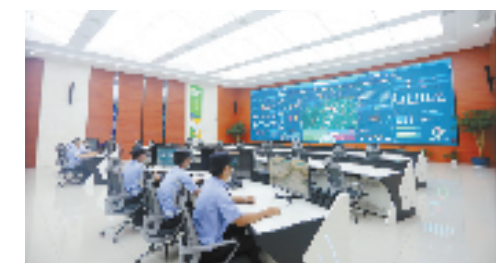
“青和翼”全域智治运营指挥中心