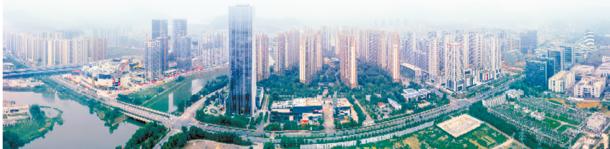
崛起的科技之城