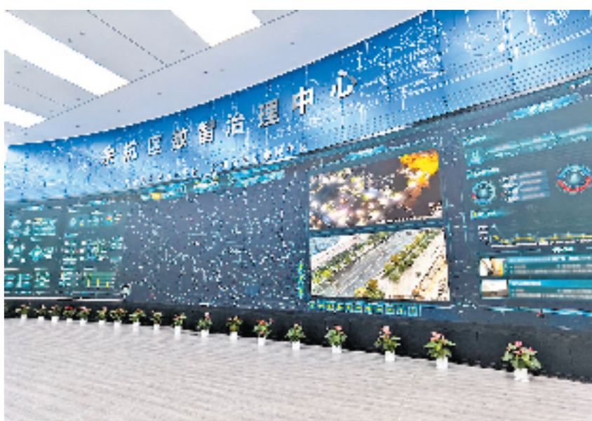
一呼百应，余杭区行政执法指挥中心。