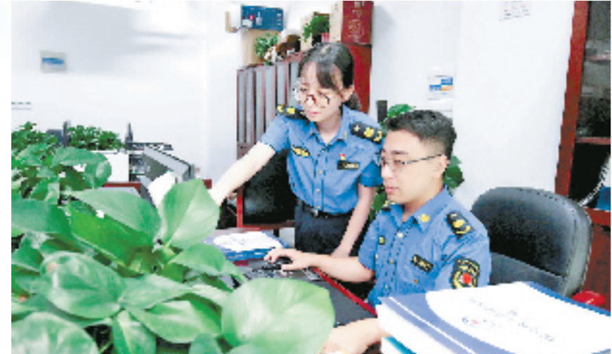
编印杭州市首部《综合执法法律法规汇编》。

近日，杭州余杭在全区范围内开展燃气安全监管一件事“大巡查”。短短两天时间，便巡查了1200多家点位，立案查处29件。“以往各个执法部门都是各自为战，现在一次检查就能涵盖多个领域，解决了‘多头执法’现象。”据介绍，通过执法通上的燃气安全“一件事”场景，短短25分钟便可完成以往需要住建、城管、市监和消防等各部门分别上门进行检查的项目，大大提升了执法效率，也受到了群众的好评。 窺一斑而知全豹。攥指成拳、高效联动的基层执法行动背后，是今年7月正式上线的余杭区行政执法指挥中心及全区所有镇街综合行政执法队在发挥重要作用。 该行政执法指挥中心依托全省首个区级“数智治理中心”，对标“指挥高效、分工合理、职责清晰、规范有序”的行政执法体系目录，初步搭建以“区—镇街—村社—网格—责任主体”为基本框架的区级指挥体系，联动“浙江省行政执法互联网+监管平台、杭州市智慧城市系统、区基层治理四个平台”等省市区三级系统平台，通过4G执法单兵记录仪、车载GPS等信息交互，实时显示执法人员、执法车辆的位置信息，就近