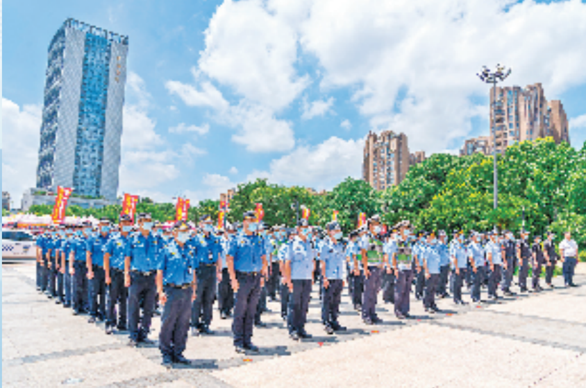
协同高效，一支队伍执法。

近日，余杭区仁和街道综合行政执法队管理大队举行了中层竞聘大会演讲。这次竞争上岗，与过去有点不一样，它打破了过去不同部门限制，不管原来是综治巡防、序化管理、防违控违，还是交通维护、消防安全、专职网格员、办办辅警等编外人员均可报名参加，所有协辅警统一考核、公平竞聘、实行竞争上岗，进一步增强了编外队伍建设，提高了编外队伍素质，也调动了他们的工作积极性、主动性和创造性。 仁和街道相关负责人介绍：“大综合一体化”行政执法改革方案实施之后，他们完成了从原先分散办公到集中办公的转变，执法队员和辅助力量的勤务安排、考核奖惩等都有了统一管理，街道对下沉（派驻）人员和辅助力量的管理制度更加健全，指挥体系更加完善。推行“大综合一体化”改革后，镇街综合行政执法队伍将肩负更多责任，更需要增强动力、厚植能力、永葆定力。怎样以更大力度精准简快执法、推动工作重心下移、力量下沉、资源下倾，形成“金字塔形”行政执法结构？打造一支“纪律严明、行为规范、作风优良”的基层治理综合执法队伍是重中之重。 为了立足治队全面提升，仁和街道综合行政执法队严格队伍管理，注重人才培养，建立了综合管理队伍培训教育体系。