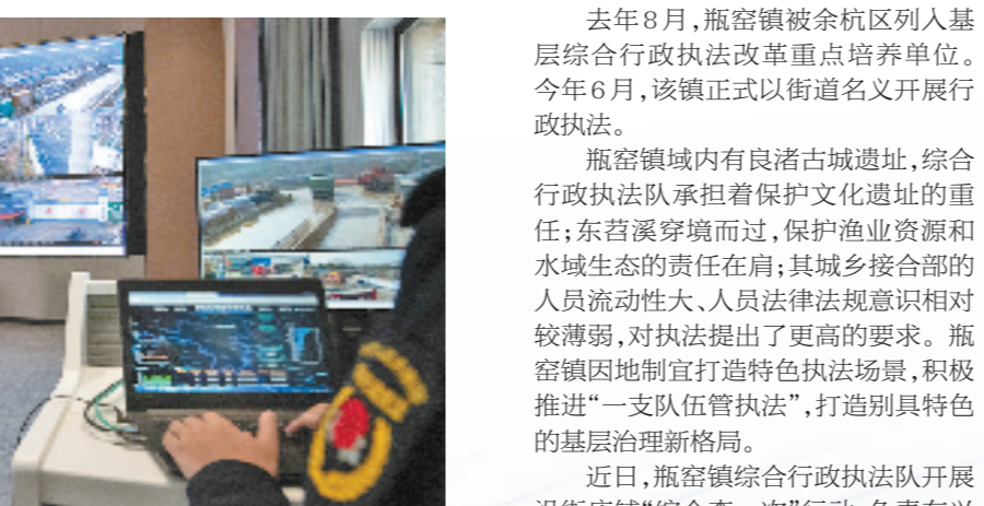
仓前街道综合行政执法队指挥中心。

仓前街道历史悠久、风景优美。今年，仓前努力推进“产业数字化”和“数字产业化”融合发展，成为余杭开辟数智发展新路径的先锋。 在余杭区“大综合一体化”改革中，仓前街道发挥数字高地的优势，以数字化改革为牵引，通过强化创新，全面运行执法监管数字化应用，努力提升“智慧化”行政执法治理效能。其数字平台“一网打通”——融合“141”基层治理体系，实现街网事警情主、任线执法、党员四联等系统平台与综合执法体系的机制联动、数据贯通，交警、数字城管全面入驻街道综合行政执法队指挥协调中心（数智治理中心），落实智能监控、非现场执法联动处置，开展无人机“云上执法”，提升工作效率。 今年6月上旬的一天，仓前街道数智治理中心的值班员接到一条数字城管采集员上报的噪音预警线索。收到信息后，仓前综合行政执法队执法人员立即出动前往现场，并通过专业仪器对噪音进行检测。 经检测，现场噪音未超过相关标准。针对预警线索，执法人员向工地负责人发放宣传单，并进行提醒宣讲。随后，执法人员通过无人机对周边工地进行巡查，并逐一走访，告知各项负责人关于中高考试题噪音管理规定，要求其共同参与禁噪降噪，护航中高考工作。 与此呼应的是，仓前街道在线指挥也实现了“一键调度”。按照可视化、数字化要求，街道建立4G云路调度平台系统，覆盖执法、监管、村社和社会“手脚”平台375个，实现在线可视化综合应急指挥调度。 通过数字赋能，仓前街道实现日常执法监管统一指挥、信息共享，集中研判、快速交办、及时反馈，一个任务快速交办的闭环也由此形成。到今年上半年，仓前综合行政执法队已累计开展“综合查一次”180余次，检查对象覆盖率提升了65%，检查频次缩减了30%，实现