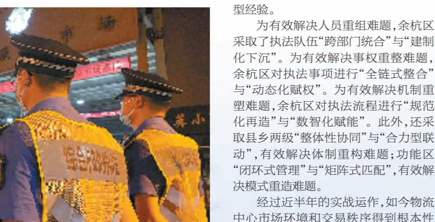
防疫保供，杭州农副产品物流整治。

今年7月1日，杭州农副产品物流中心综合行政执法队正式成立，这也是全省首支专业功能区综合行政执法队。事实上，早在成立前他们已经试运行了100多天。 今年4月，余杭区良渚街道发生疫情。抗疫保供，刻不容缓，为保障市场平稳有序运营，也为了守护来之不易的防疫成果，余杭区决定在杭州农副产品物流中心（简称物流中心）区域周边，开展专项整治行动。整治初期，为确保联合执法高效协同，余杭区结合“大综合一体化”行政执法改革，将多部门执法人员整合至一支队伍，在物流园区及周