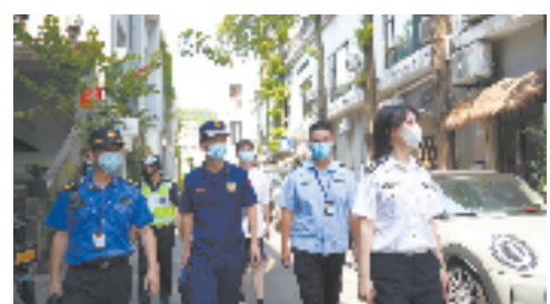
上城区综合行政执法队对辖区文创园开展“综合查一次”

协调更有效。上城区建立完善了“1+1”协调机构。在区级层面，基于改革工作领导小组，增设改革协调议事领导小组，实现综合执法和基层治理的纵向贯通、横向衔接；在街道层面，由街道党工委书记担任协调机构主任，街道办事处主任担任综合行政执法队队长，增配常务副队长抓改革实战实效，强化街道“统一调度、统筹指挥、块状作为”。支撑更强大。上城区做强基层法治支撑，设立区街两级法治审核机构。区级层面，成立司法法制审核专家委员会；街道层面，建立三级法制审核制度，并在司法所设立“监督办公室”，负责街道日常行政执法的规范性、合法性指导和监督工作。保障更有力。在“县属乡用共管”机制基础上，上城还建立了“五赋权、一约束”执法人员管理保障制度，赋予街道指挥协调、管理考核、推荐提名、反向否决以及街道对部门的法制支撑反向评价等5项权力，以部门考核街道并将结果纳入区综合