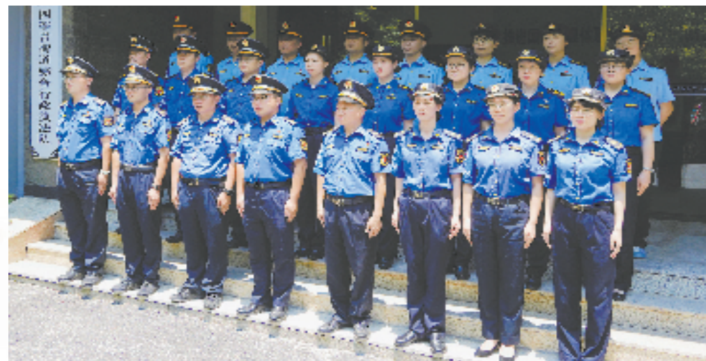
上城区开展队列训练提升执法队伍形象