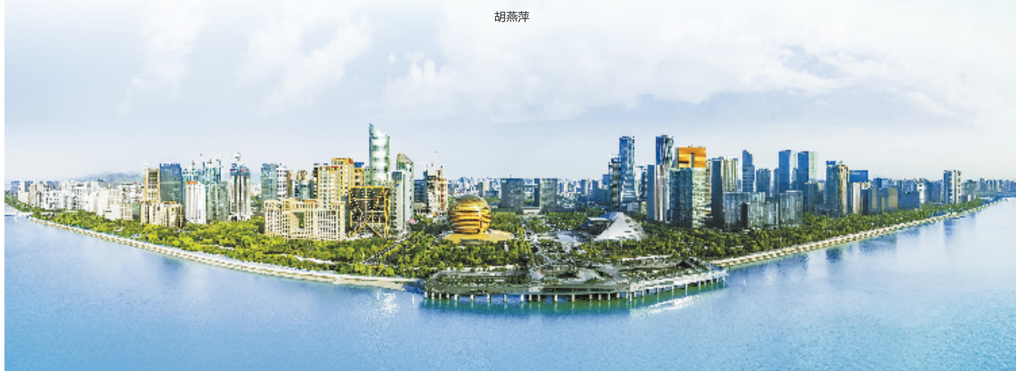
上城区钱江新城全景图