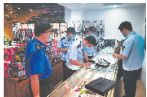
上城区综合行政执法队联合公安等部门对某珠宝店进行突击检查，针对抽奖券及垃圾分类等问题进行“综合查一次”。