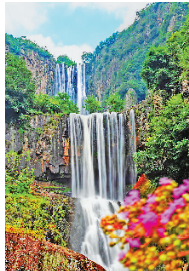
位于温州文成的百丈瀑。

最新的温州市生态环境状况公报显示,温州城市环境空气质量优良率98.9%,省控以上地表水断面水质Ⅰ类至Ⅲ类比例93.8%,达到历史最好水平,温州生态满意度连续12年提升。