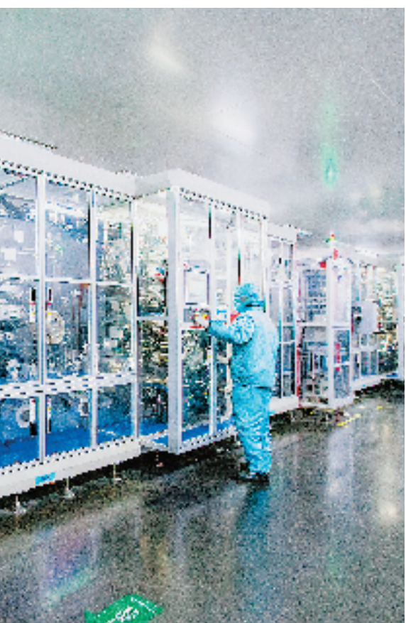
青山控股集团旗下瑞浦能源有限公司已成为国内动力电池装机量排名前十企业。