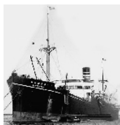
“里斯本丸”号船

“这次习主席复信‘里斯本丸’号船幸存者家属,也为舟山未来对外交流发展进一步指明了方向。”舟山市外