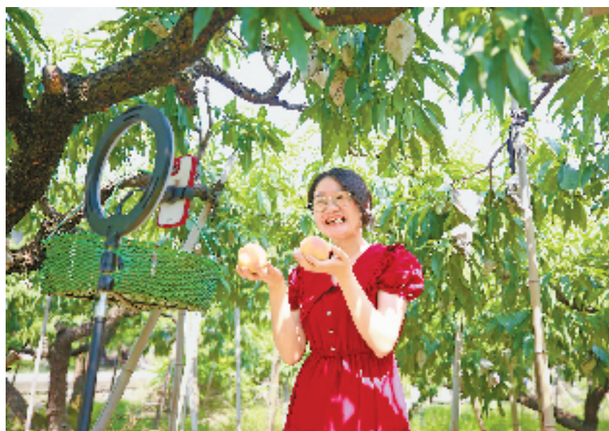
在嘉兴市南湖区凤桥镇,新农人在果园直播卖桃。