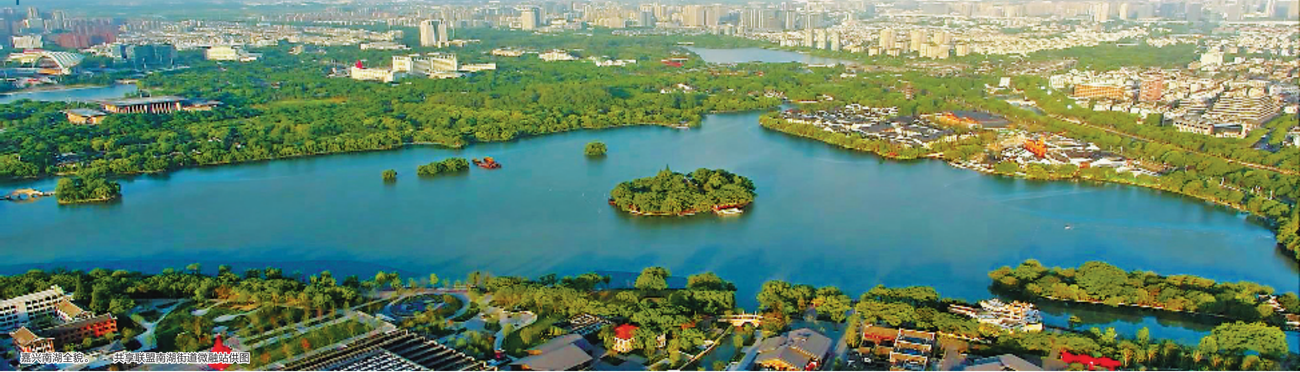
嘉兴南湖全貌。