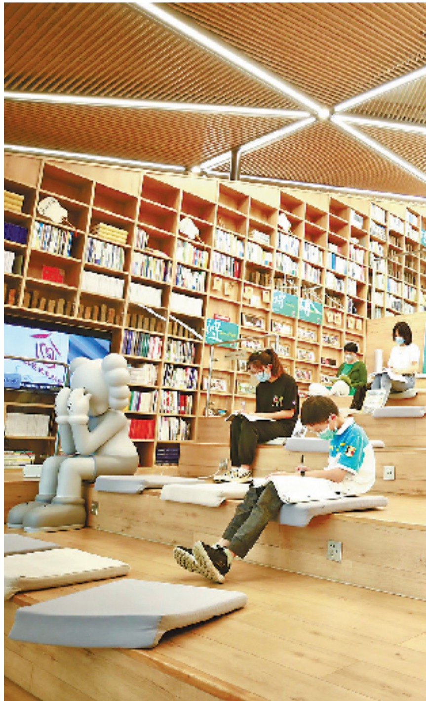
“禾城驿·温暖嘉”城市驿站里,市民们乐享书香。

发展潜力,全面深入推进新时代文化高地文明高地建设,文化强市的辨识度越来越明显。近日,浙江省2021年度公共文化服务现代化发展指数(CMDI)评估结果公布,嘉兴基层公共文化服务评估实现全省“九连冠”。嘉兴不断巩固国家公共文化示范区创建成果,率先开展文化馆企业分馆创新探索和公共图书馆总分馆“健心客厅”建设服务,在城市空间嵌入式打造“禾城艺”公共文化服务新品牌。2021年建党百年之际,更有歌剧《红船》、大型原创民族舞剧《秀水泱泱》首演,全国美术精品创作工程暨第五届“红船颂”全国美展开展,一系列红色群众文化活动精彩纷呈。今年,嘉兴创新推出“精神富有·润心在嘉”十大标志性项目“十心行动”,随着农村种文化、便民服务区覆盖、心理健康服务品牌建设等活动推开,一个“10分钟品质文化生活圈”正铺陈开来。