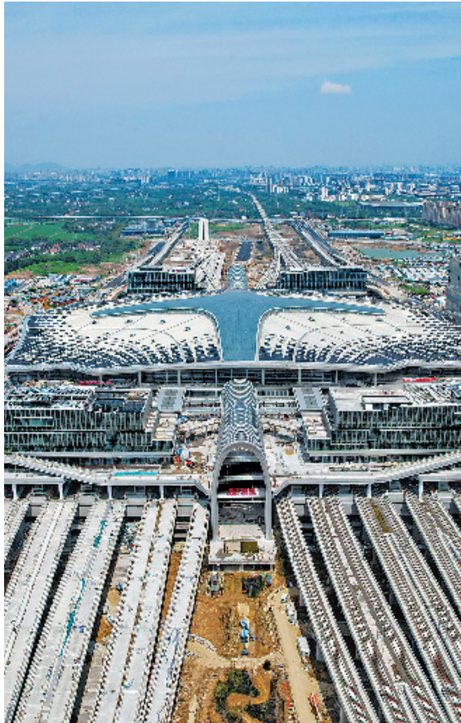
建设中的杭州西站。

城市因文化而更精彩,生活因文化而更美好。杭州正朝着一流历史文化名城踔厉奋发,让世界看见这座新天堂的千年“老底子”。