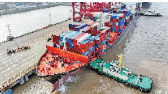
集装箱轮靠泊在宁波舟山港大浦口集装箱码头。

近年来,浙江自贸试验区舟山片区“一中心三基地一示范区”和油气全产业链建设取得重大突破,大宗商品资源配置能力显著增强,舟山在全球大宗商品市场中的话语权和市场份额进一步提升。数据显示,今年上半年,舟山新增油品企业805家;规上石化工业产值同比增长83.3%;船用燃料油直供量276.27万吨,同比增长13.2%。