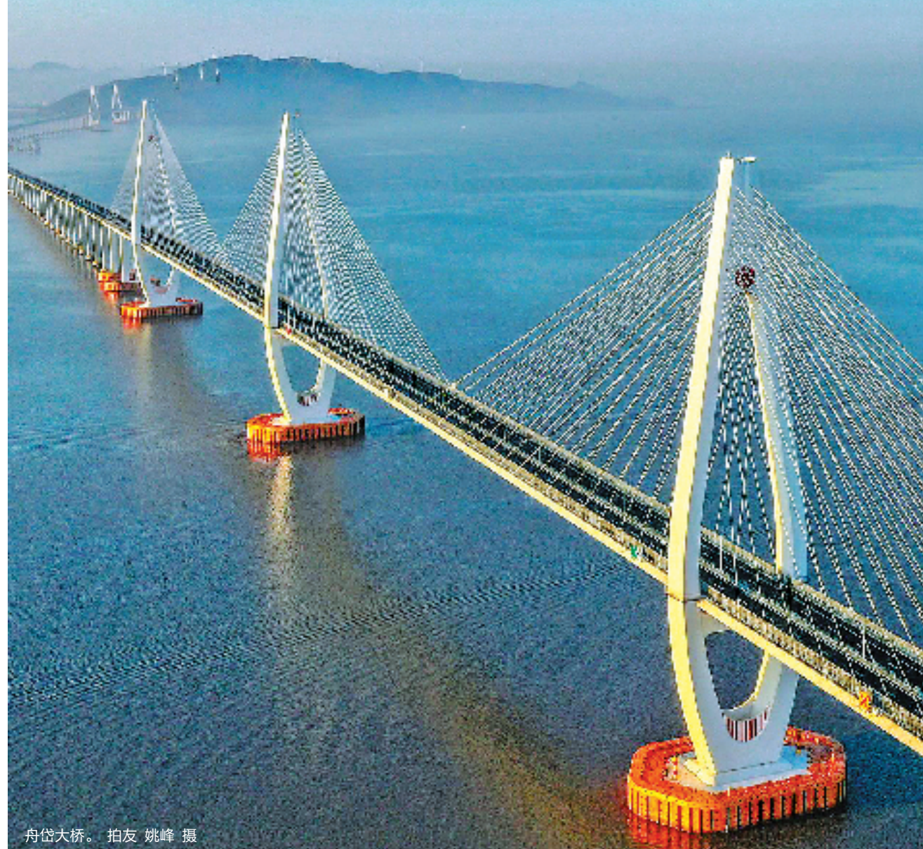
舟岱大桥。