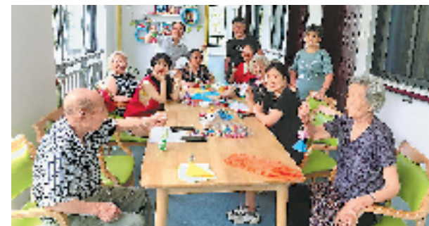
海岛支老人员和志愿者为嵊泗老人提供文娱活动。

随着“小岛你好”海岛共富行动的实施,舟山将继续完善养老服务体系,提升偏远海岛养老服务护理水平,推动全市养老服务区域一体化,让老年人老有所养、老有所安、老有所乐。