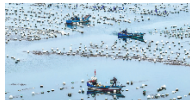
嵊泗县枸杞岛海上牧场。

今年上半年,舟山市空气质量继续保持全国第三,海岛自然岸线保有率达到72.26%,近岸海域水质优良率38.7%,同比上升3.3个百分点。