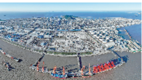
舟山绿色石化基地。