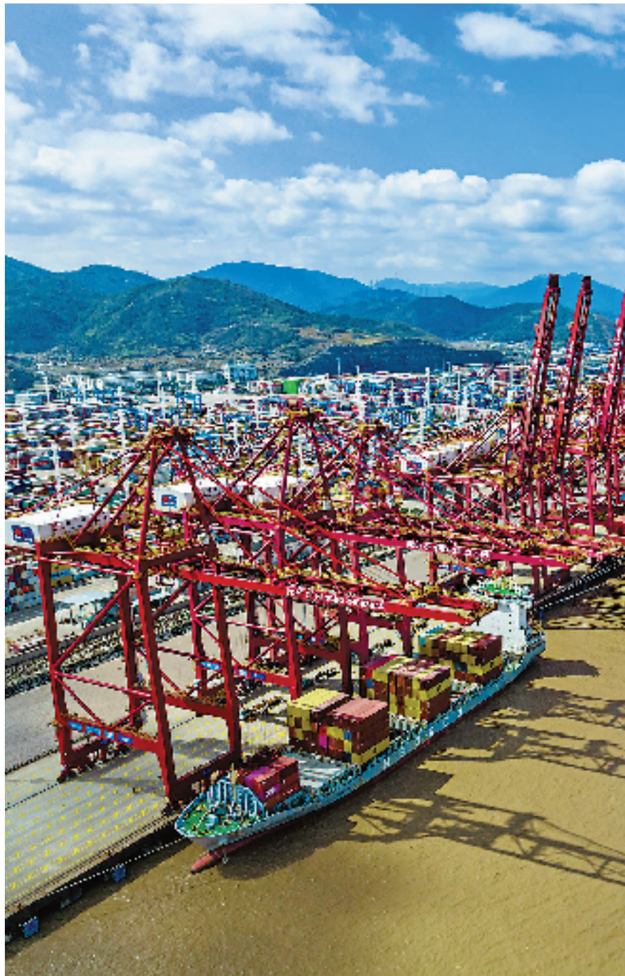
繁忙的宁波舟山港。

科研工作站等创新“大脑”,如今手握120多项专利,还主持和参与了9项国家标准的制定。 扎根某个细分领域精耕细作,专注创新掌握人无我有的核心技术,正是宁波的制胜法宝。全球汽车零部件巨头均胜电子、全球反射膜龙头长阳科技、填补国内溅射靶材工艺空白的江丰电子、研制我国首台微重力太空显微实验仪的永新光学……这群“冠军企业”个个身怀绝技,不少主导产品市场占有率全球第一。 “超12万家制造民营企业,是宁波制造的底色,也是工业经济活力所在。”宁波市经信局有关负责人介绍,十年来,宁波聚焦打造世界级先进制造业集群,现形成绿色石化、汽车制造等8个千亿级产业集群,拥有11个全国唯一的特色产业基地,工业增加值跃居全国第七。