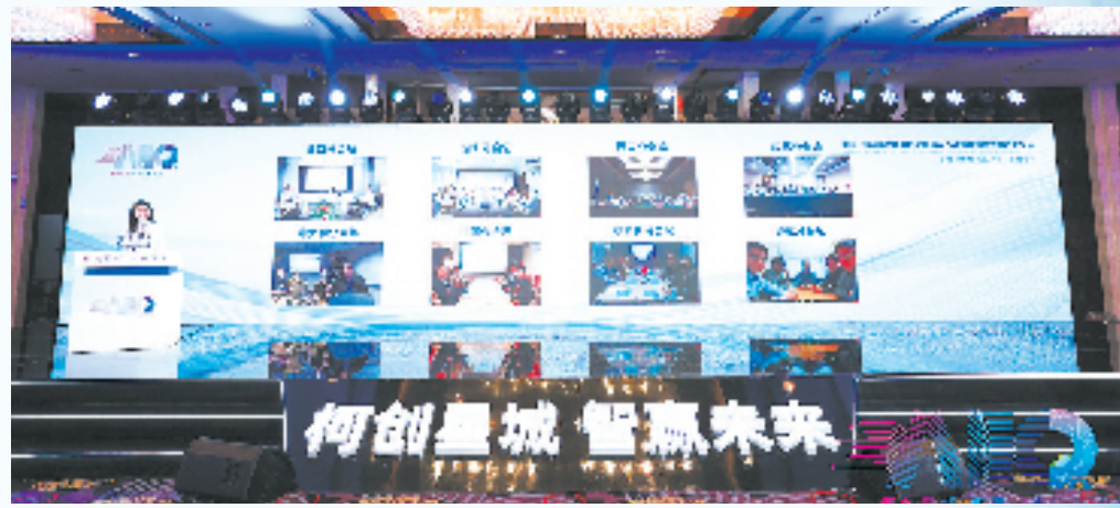
中国·绍兴第七届海内外高层次人才创新创业大赛