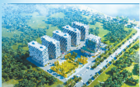
宇越光学膜材料制造项目(山海协作产业飞地百亿项目)

上，每米印染布附加值提高15%以上，亩均税收从集聚前的13.47万元提高到23.5万元，成为全省传统行业改造提升示范案例，得到省委领导的批示肯定。”柯桥经开区有关负责人说道。