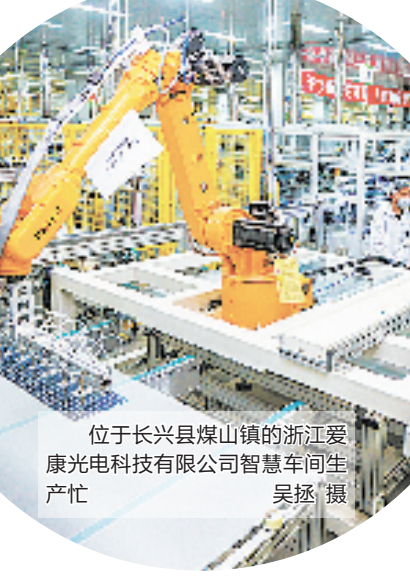
位于长兴县煤山镇的浙江爱康光电科技有限公司智慧车间生产忙

向绿向新,当发展空间受限,湖州开始在山谷里做起文章。从2020年开始,该市在宁湖杭生态创新廊道上,布局弁山“云起谷”、西塞“科学谷”、阳山“时尚谷”、顾渚“画溪谷”和莫干“论剑谷”五座“创谷”,在绿水青山间布局前沿技术攻关、应用技术研发以及科技成果转化的创新全链条。