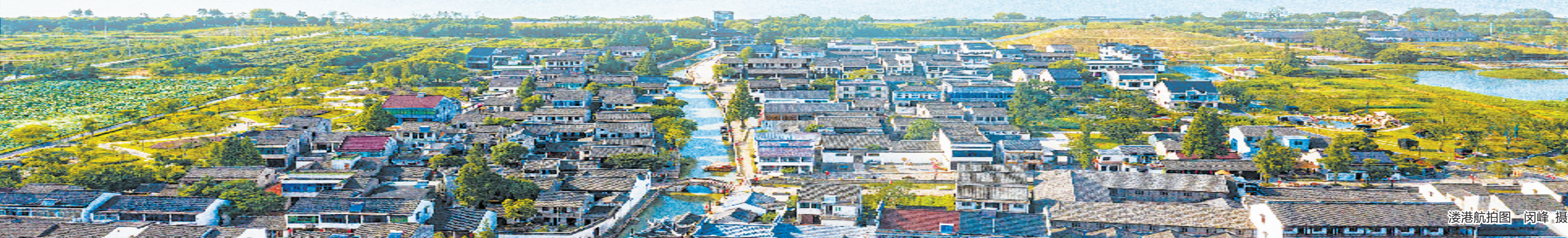
溇港航拍图