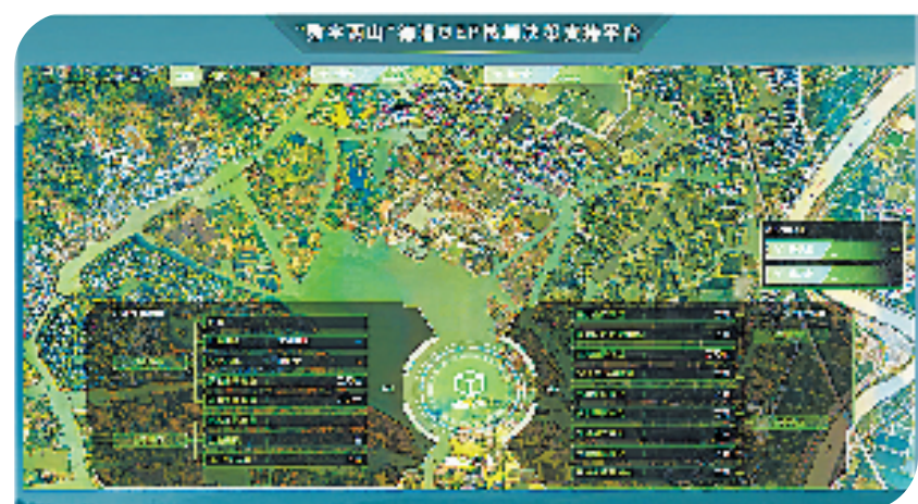
德清GEP核算决策支持系统