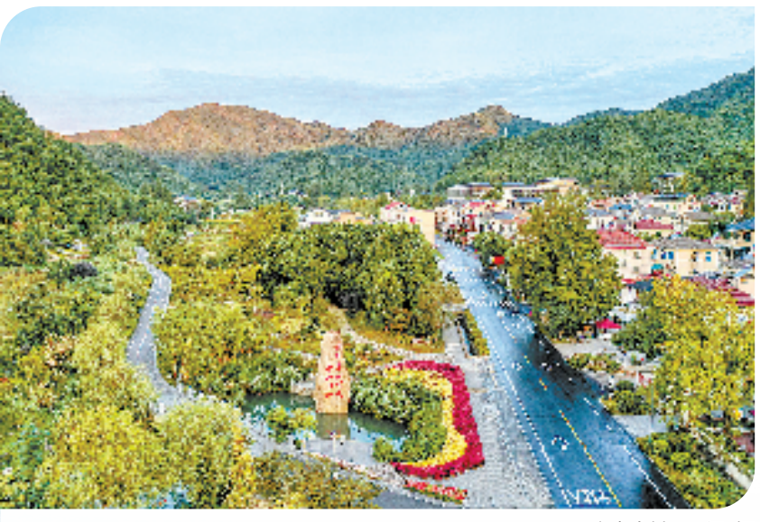
安吉余村