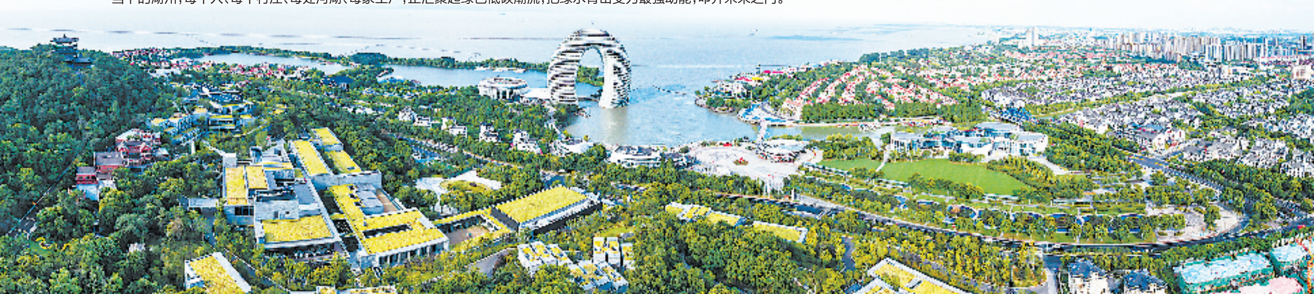
满目皆绿的南太湖畔

当下的湖州,每个人、每个村庄、每处河湖、每家工厂,正汇聚起绿色低碳潮流,把绿水青山变为最强动能,叩开未来之门。