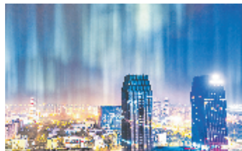
未来大厦

据统计，去年以来，发放“浔城乐购惠”“留浔过年”“惠享南浔”等各类电子消费券共2400万元，带动消费超6000万元，有效激活消费潜力。同时借助“蟹客大会”“花海龙虾节”“浔梦环游”等区内消费品牌活动，营造良好促销氛围。