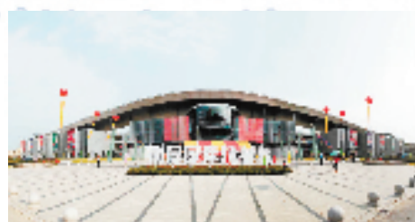
中国·南浔建材家居数字贸易创新发展区

全链条的数字化改造，以数字贸易为产业发展导向，推进建材家居产业与数字贸易深度融合，打造产业发展现代化、平台运行数字化、基础设施智慧化的现代服务业创新发展区，赋能传统优势产业，充分发挥数字技术对经济发展的放大、叠加、倍增作用，为企业带来新的发展机遇。”南浔区相关负责人介绍。