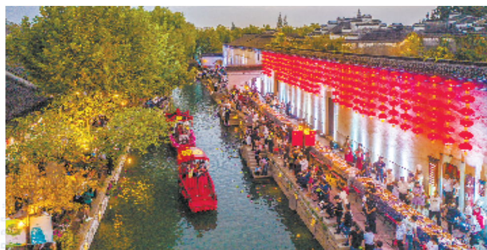
南浔古镇数字文旅创新发展区·长街宴