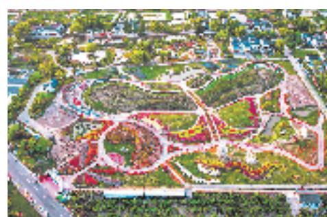
石凉花海

一提到南浔，映入脑海的就是“小桥流水人家”的新江南生活范式——南浔古镇。作为世界文化遗产和湖州市首个5A级景区，如何突破传统景区路径依赖，是当前亟需破题的关键。