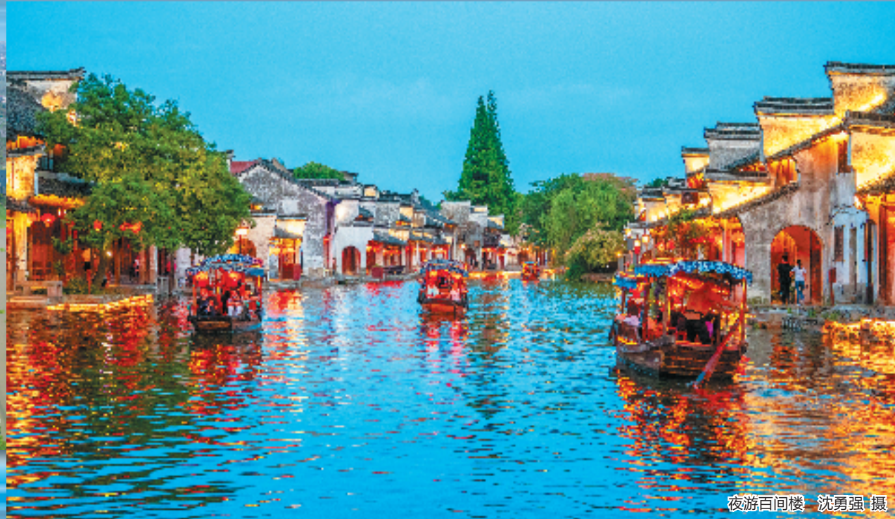
夜游百间楼