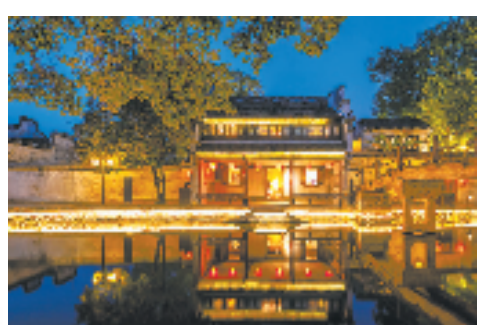
园舍民宿