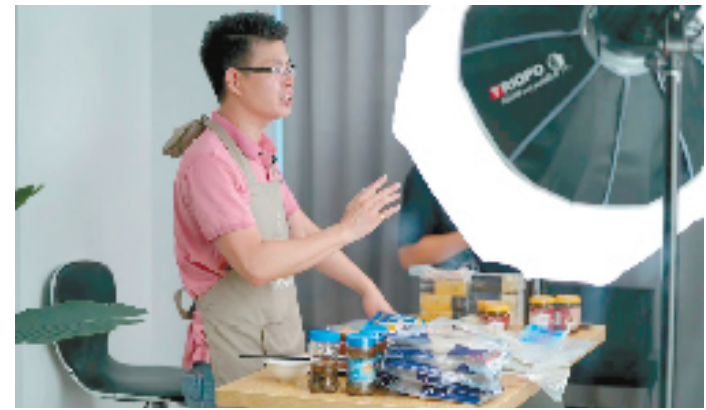
农播客直播带货

为推进现有优质品牌从线下到线上转型,配套电商经济发展,举办电商供应链选品大会,对接品牌与平台渠道。温州市农业农村局部门,通过成立农播客联盟、开展农播客培训等助力农播客建设。计划通过三年时间,从“人”“货”“场”三方面给予支持,达到引育一批直播服务机构(MCN机构),建设一批农播客基地、培养一批网红带货达人、整合一批供应链、孵化一批网红爆款产品的目标,从而进一步增强温州农播客商影响力,加快乡村振兴、共同富裕步伐。