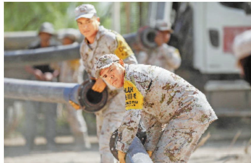
8月7日,在墨西哥北部科阿韦拉州萨维纳斯市,救援人员在坍塌矿井附近工作。该市一座煤矿矿井3日发生坍塌,目前仍有10名矿工被困在矿井中。