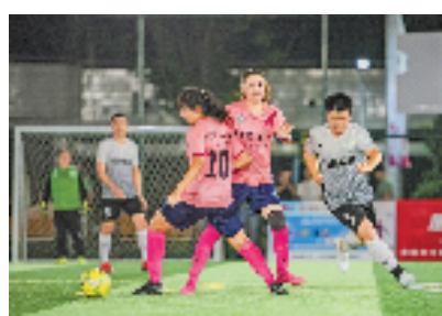
王店女足代表队员在赛场上与男子球队比拼。