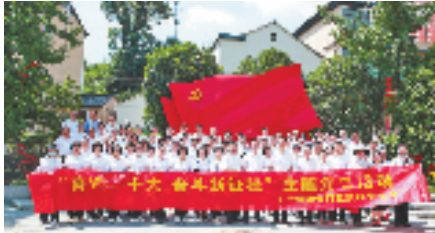
工行金华分行通过开展形式多样的主题党日，积极推进党建和业务深度融合，努力践行金融为民的初心与使命。

数据，利用大数据、云计算，为科技、医药、互联网等“轻资产”小微客户提供小额信用贷款，以全流程线上化服务解决小微企业“短、小、频、急”融资需求。截至今年6月末，银监普惠口径贷款余额198.24亿元，较年初增加了36.48亿元，贷款增速22.55%。