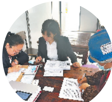
利用移动设备搭建“临时银行”，工行现场为工地务工人员提供一站式金融服务。