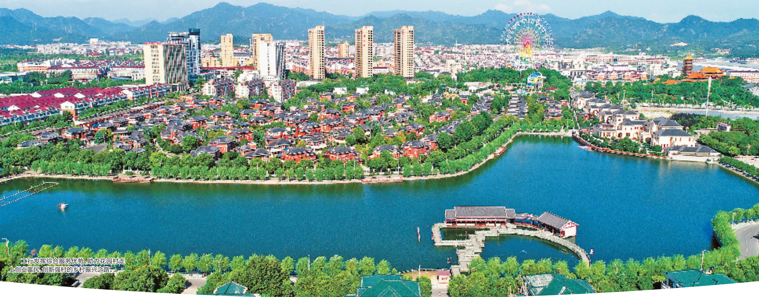
工行发挥综合服务优势，助力花园村走上创业富民、创新强村的乡村振兴之路。

今年6月，该行各项贷款余额1463亿元，比年初增加196亿元；涉农贷款余额661亿元，比年初增加108亿元；制造业贷款余额411亿元，比年初增加40亿元；民营贷款余额724亿元，比年初增加114亿元；项目贷款突破200亿元大关。近年来，该行荣获浙江省首批“社会化拥军成绩突出单位”、金华市政府颁发的“金华市模范集体”等荣誉称号。