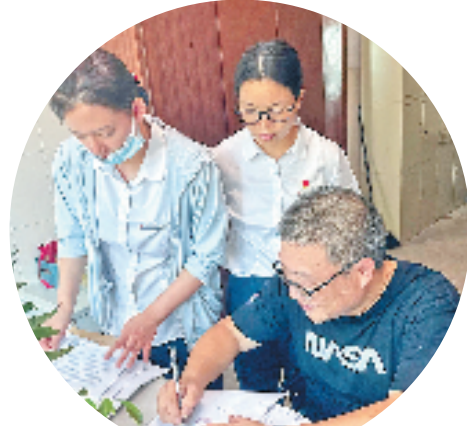
工行客户经理走访浙江三亨工贸股份有限公司洽谈贷款业务。