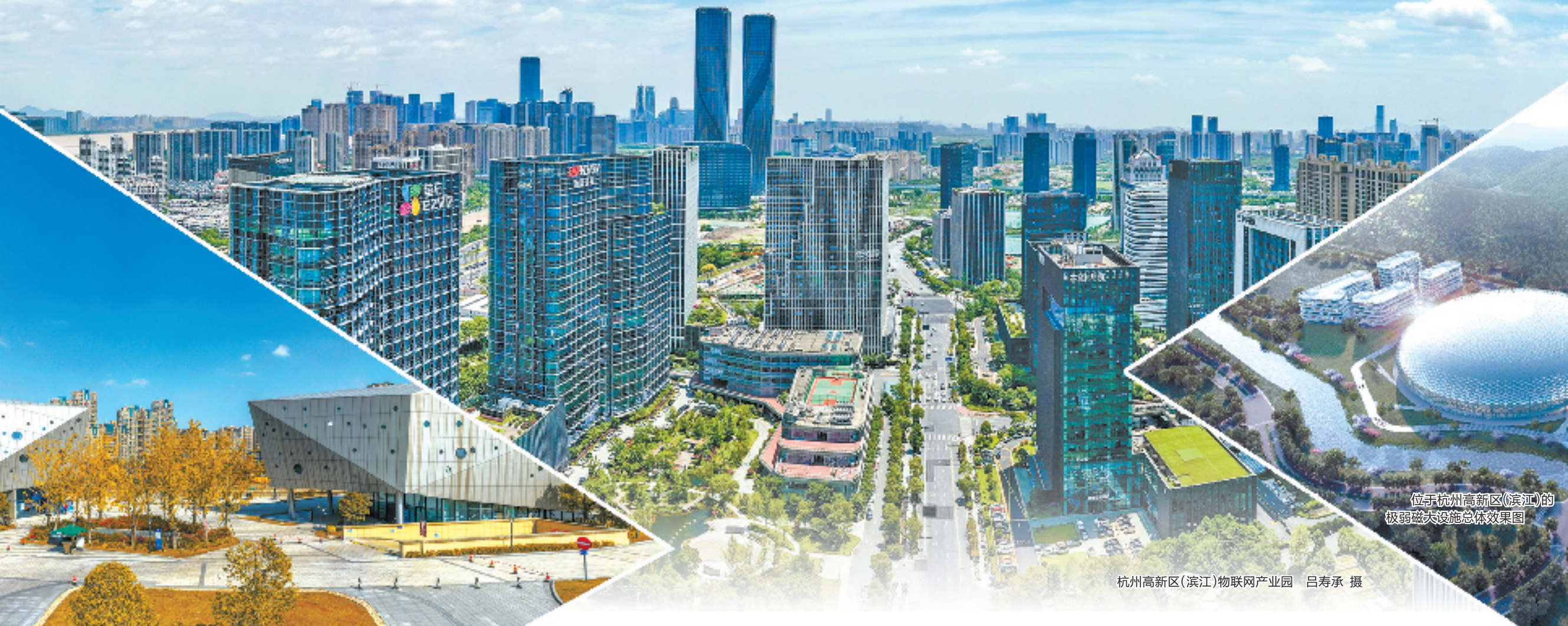
位于杭州高新区(滨江)的极弱磁大设施总体效果图

8月2日召开的滨江区委六届二次全会，将目光锁定提升高质量发展的“续航力”，谋定了未来跃升的路线图：坚持创新制胜，攻坚稳进提质，建设“天堂硅谷”、打造“硅谷天堂”，以持续高质量发展冲锋“两个先行”。