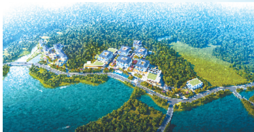
位于杭州高新区(滨江)的白马湖实验室效果图

数字基建、社会民生、商业配套、现代产业和特别合作园建设等重点领域，放大亚运效应，高效实施城市有机更新，研究布局一批电力设施、水利管网、交通道路等基础设施重大项目，力争区内全年投资超300亿元。