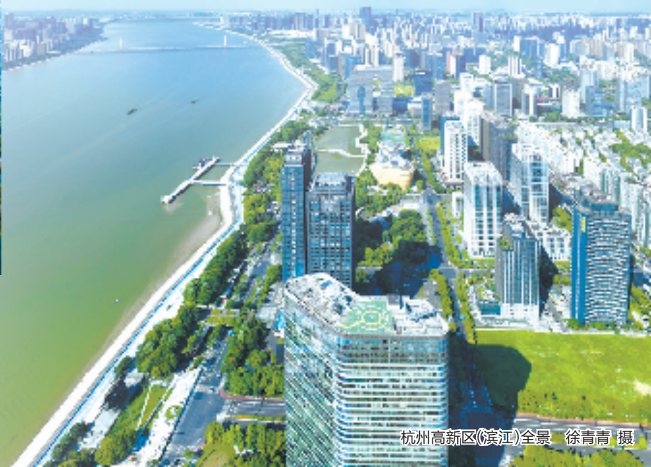
杭州高新区(滨江)全景