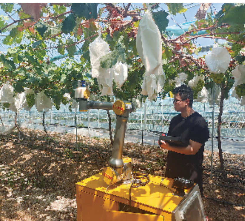
机器人摘葡萄