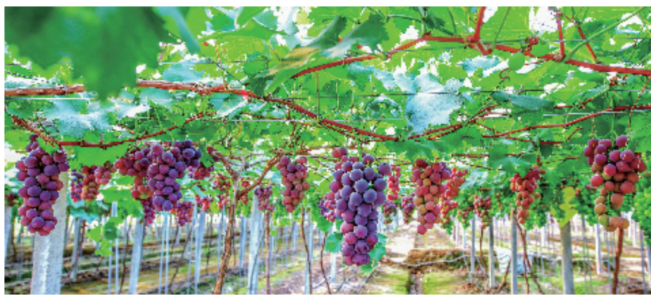
浦江巨峰葡萄