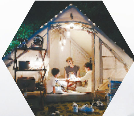
市民在金华山小西湖露营基地露营