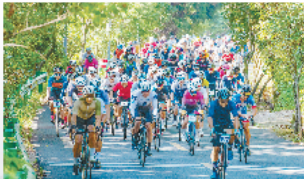
“环八婺”金华市自行车爬坡联赛(金华山站)

金华山将继续加快建成“生态名山”“文化名山”“康养名山”“共富名山”,继续培育生态、文化、康养等旅游新业态,努力将金华山打造成为特色鲜明、全国知名、世界有影响的中国特色文化名山、国际化道养休闲旅游目的地。