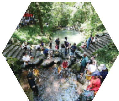
金华双龙风景区游人如织