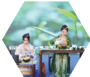
宋韵·金华山森林露营节点茶表演

因此,唐代杜光庭在《洞天福地岳渎名山记》中说:“金华山金华洞元洞天,五十里,在婺州金华县,有皇(黄)初平赤松观。”——把金华山列为道教的“第三十六洞天”。