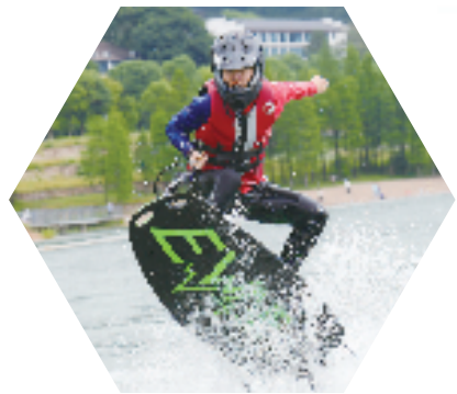
金华山电动冲浪板主题健身活动