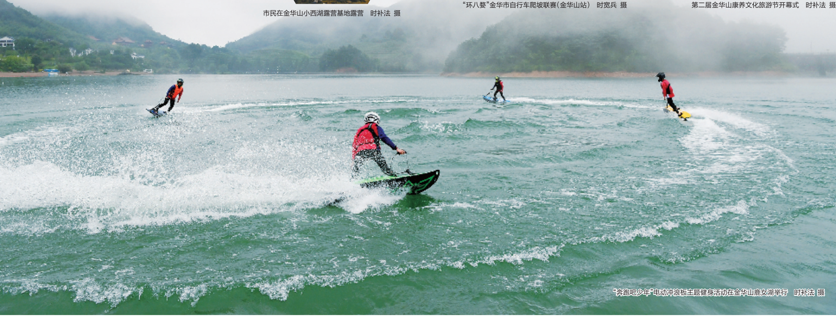
“奔跑吧少年”电动冲浪板主题健身活动在金华山鹿女湖举行